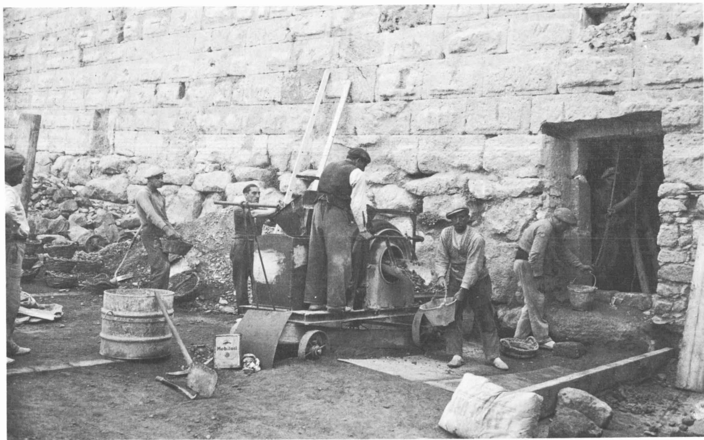
Vista des de l'exterior de la muralla. (Fotografies d'Hermén Vallvé)