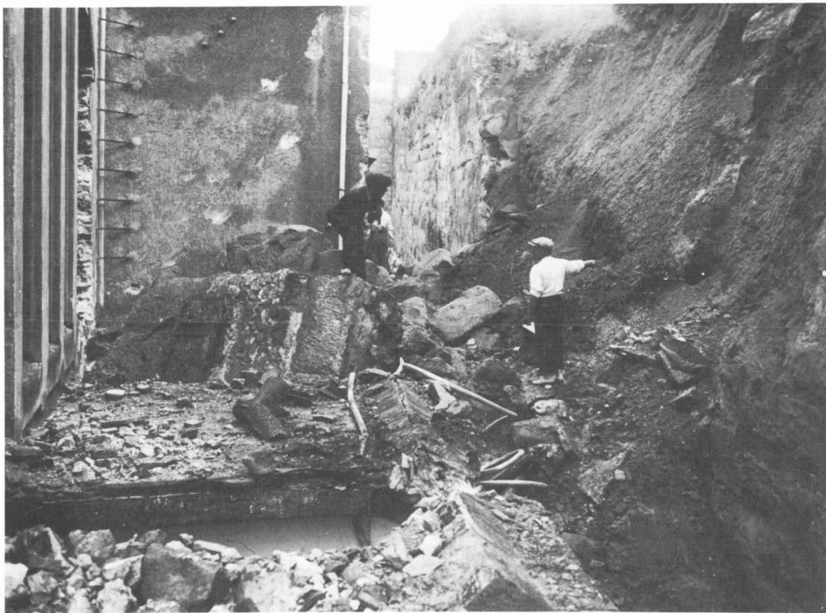
Vista des del pati de l'Escorxador.