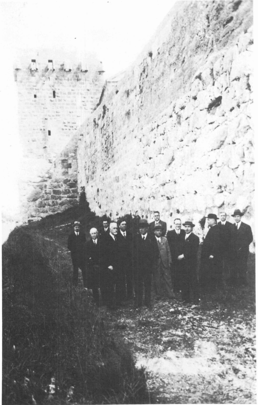
El mateix grup davant de la Torre de l'Arquebisbe.