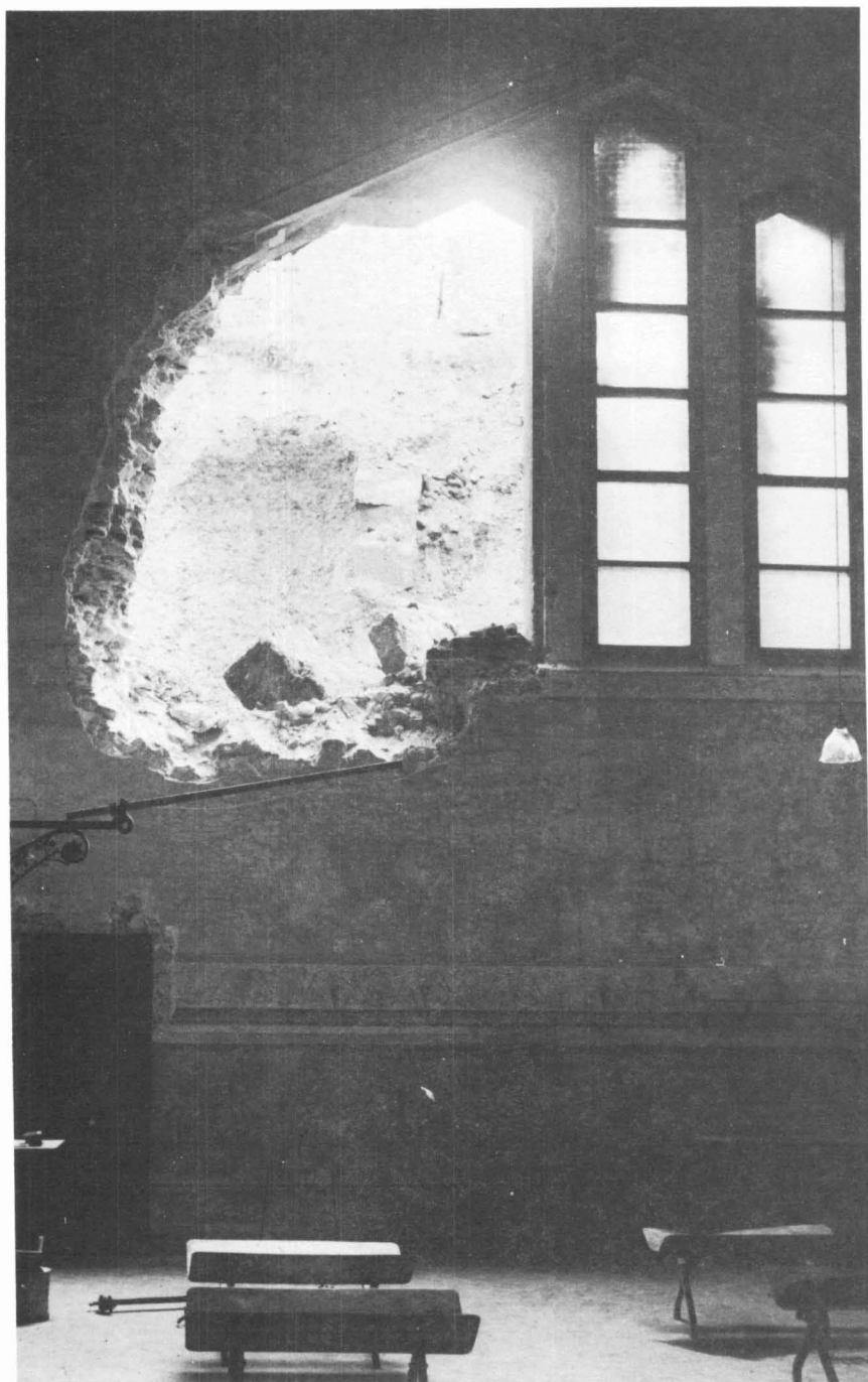
1936, juny. Vistes de la part de la muralla ensulsida la matinada del 18 de maig de 1936. Vista des de l'interior de l'Escorxador.