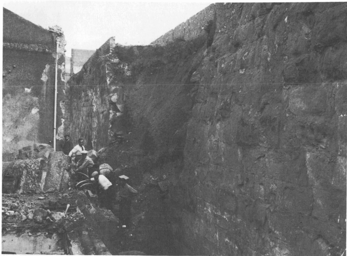
Vista des del pati de l'Escorxador.