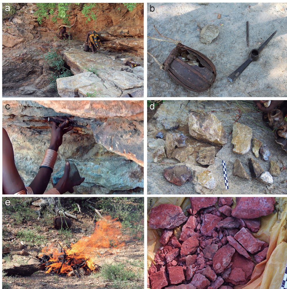
Fig. 2. Extracción y preparación de la materia prima. a) Afloramiento calcáreo donde se extrae la materia. b) Herramientas para la extracción. c) Extracción de colorante. d) Colorante antes del tratamiento térmico. e) Hoguera donde se calienta el colorante. f) Colorante después del tratamiento térmico.

9,5 cm de largo, 9 cm de ancho y 9 cm de espesor; 1 kg de peso) y un molino (bloque de 40 cm de largo, 30 cm de ancho y 20 cm de espesor) hechos de rocas metamórficas (fig. 3 a,b). Las dos herramientas ponían de manifiesto un uso prolongado porque ambas mostraban zonas desgastadas y el machacador evidenciaba facetas (zonas planas) cubiertas de estrías producidas por fricción contra una superficie dura, así como cúpulas de impacto en los laterales. En el molino, completamente cubierto de colorante, se advertían, en la zona de trabajo, dos concavidades cubiertas de estrías longitudinales.