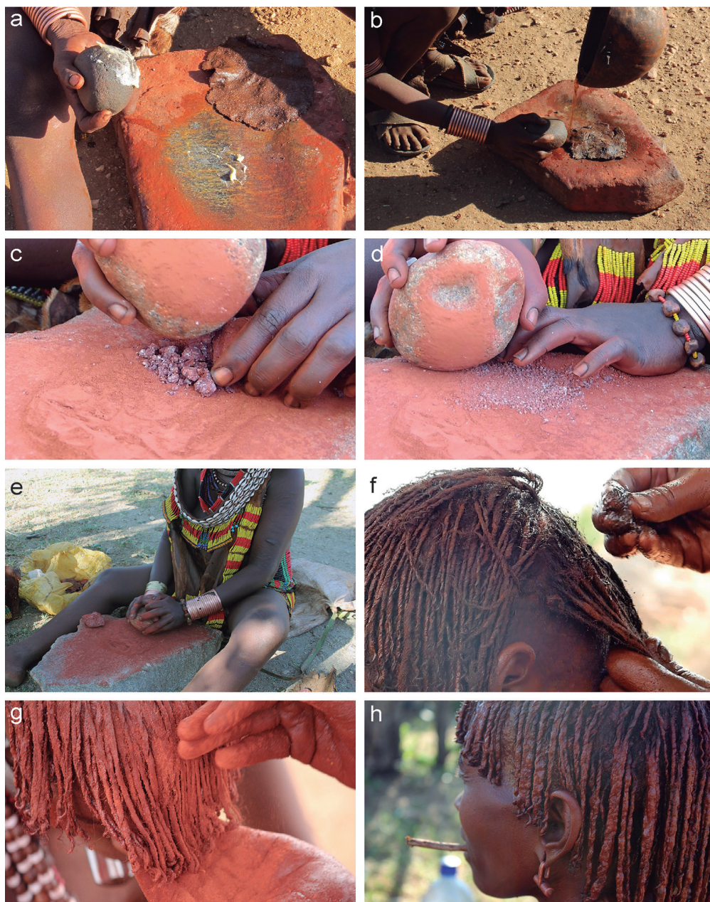
Fig. 3. Preparación del aglutinante, producción del polvo y aplicación sobre el cabello. a) Preparación de la goma con mantequilla. b) Preparación de la goma con café. c) Fracturación del colorante. d) Producción de polvo de colorante grueso. e) Producción de polvo de colorante fino. f) Aplicación de la goma. g) Aplicación del colorante. h) Resultado final.