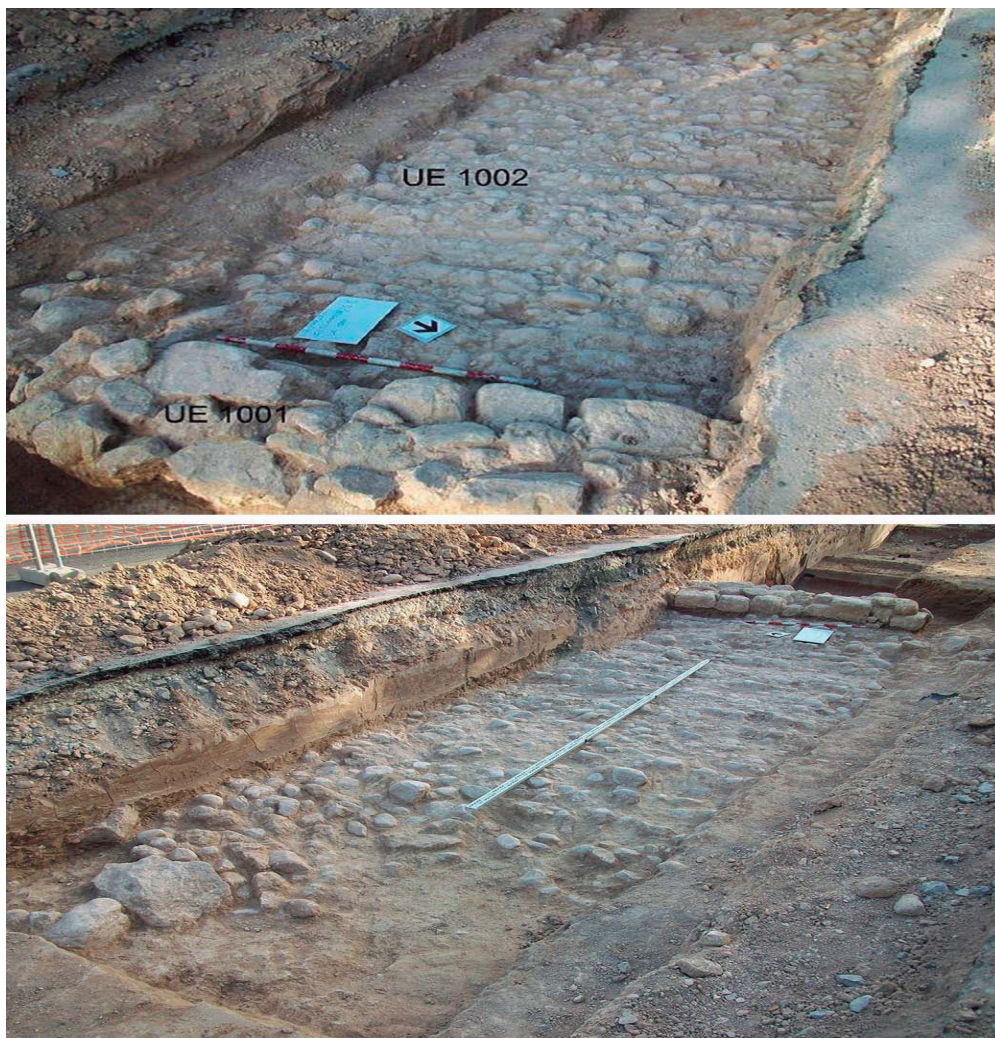
Fig. 9. Tramo de vía en la C/ Olimpo n.º 38 excavada en 2011.

C/ Olimpo y el Impiva-Fundesem. Este nuevo tramo presentaba un pavimento o empedrado de cantos rodados, de pequeño tamaño en su mayoría, dispuestos horizontalmente, con suave pendiente hacia el oeste (al igual que la calle) y extendido hacia el oeste de un muro (UE 1001). La anchura conservada de la vía es de 1,90 m, aunque parece que en el lado oeste el pavimento está muy erosionado. El material cerámico encontrado hizo pensar que fue construida en el cambio de era o durante la primera mitad del siglo I dC. Bajo el camino se halló la UE 1004, formada por arena de tonalidad anaranjada,