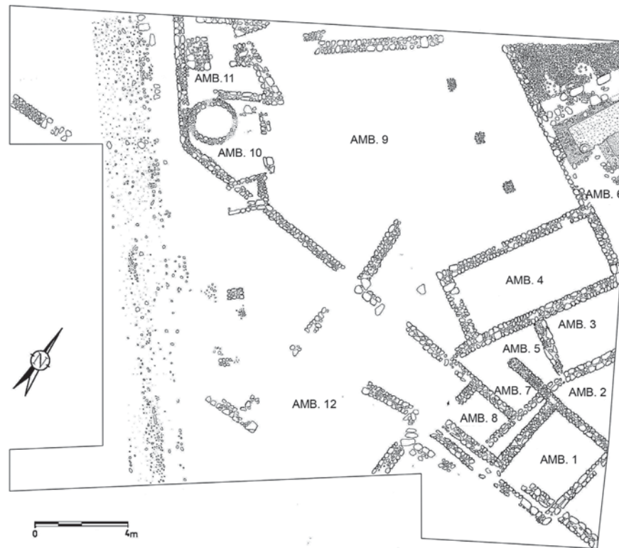
Fig. 2. Plano general del yacimiento con detalles fotográficos (originales de López-Jover, 1998).