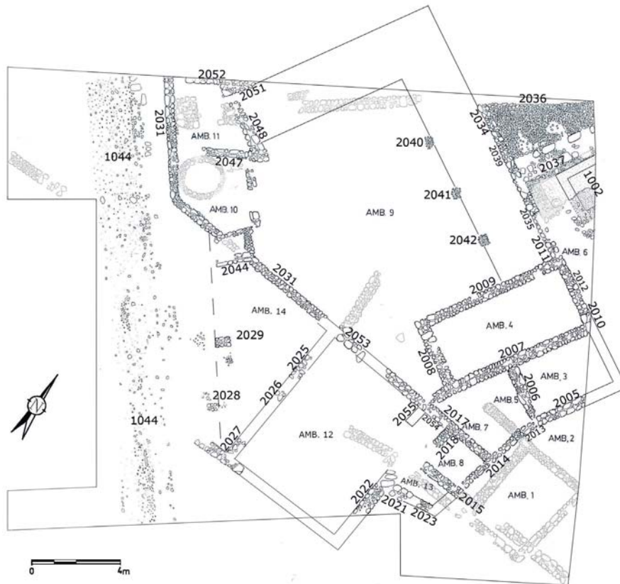
Fig. 5. Plano de la fase III.

En el sector occidental (amb. 10 y 11) se observa una remodelación que supone la amortización de la UE 2050 (posible horno) y la construcción de nuevos muros (UUEE 2046, 2045 y 2044, por un lado, y 2047 y 2052, por otro) que compartimentan esa área. El nivel de uso de esos espacios en esta fase (UE 1026) ofrece una cronología indeterminada del siglo I dC, pero en cualquier caso posterior a UE 1055, a la que cubre, y por tanto de la segunda mitad del siglo I dC.