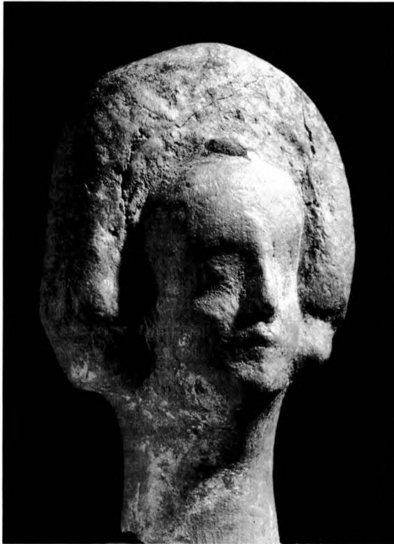
FIGURA 4. Cap de "tanagrina".

damunt s'aixeca una lligadura molt alta, com una mena de perruca voluminosa, que envolta el rostre, dibuixada per un rodet d'argila que va d'una arrecada fins a l'altra. Entre el cabell i la lligadura, sobre el bell mig del front, du un aplic circular o perla. Les arrecades són grosses i no s'arriba a apreciar bé si representaven un botó, un rodet o una flor. La cara està dissenyada amb certa finor, amb un front molt ample, nas fi i llarg, ulls grossos i llavis ben dibuixats.