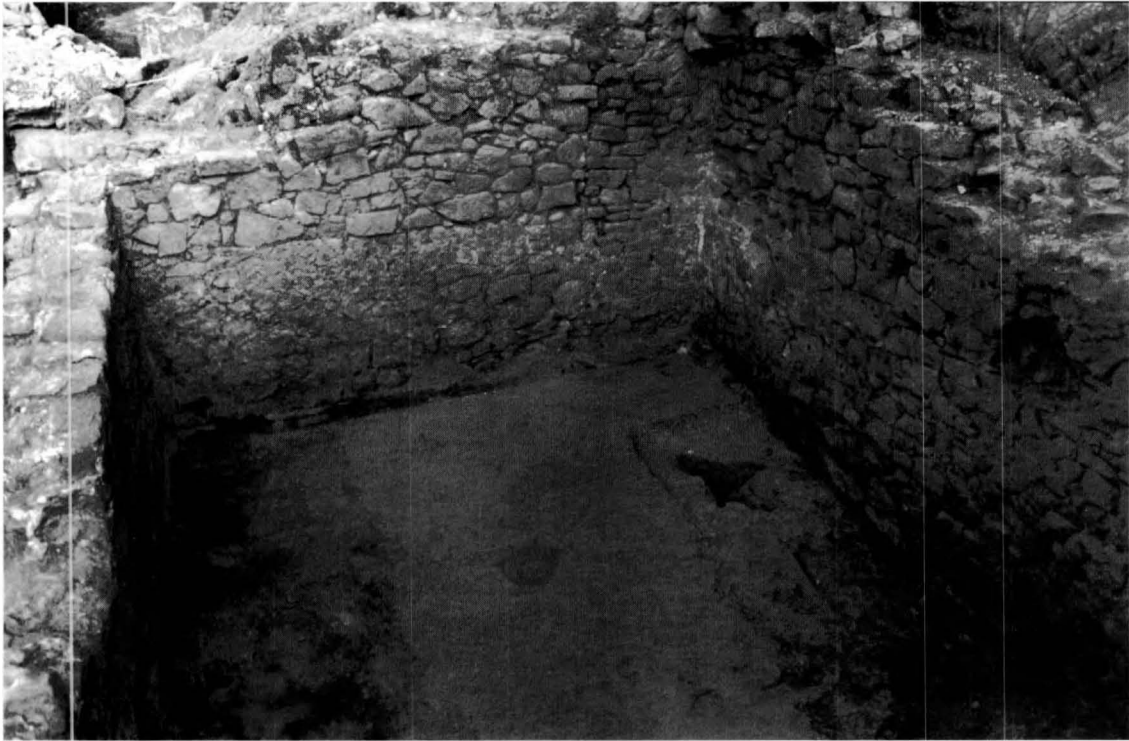
FIGURA 3. Detall de la cisterna romana.

4- Els dos possibles trams de paret romana són els indicats a la planta (fig. 1) amb el núm. 4. No s'hi ha trobat cap estrat associat que permeti datar-los. És simplement el tipus de fàbrica, amb pedres disposades en filades horitzontals i el morter de bona qualitat, similar al de les parets de la cisterna, allò que fa pensar que es tracta d'obra romana 2 .