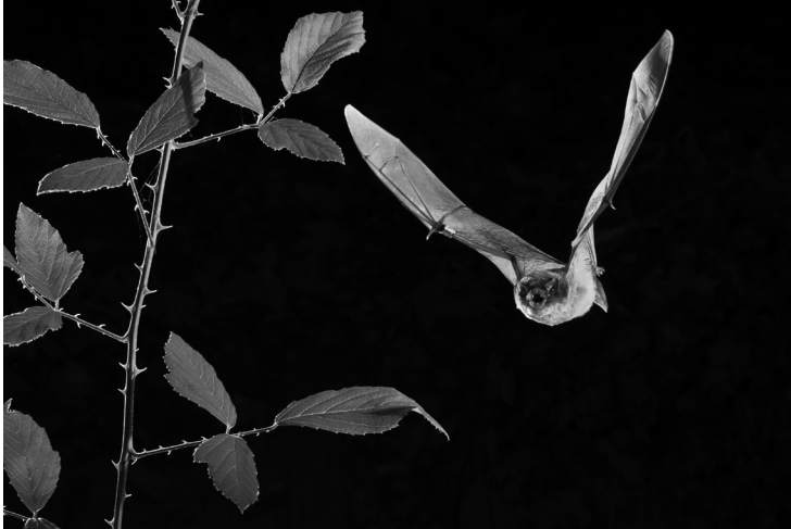
Ratpenat de cova ( Miniopterus schreibersii ) en vol (Fotografia: Oriol Massana i Adrià López-Baucells).

La por que els humans tenim del que no podem veure bé i ens és desconegut, sobretot si es mou de nit, ha provocat que des de temps ancestrals s'hagin generat històries més o menys fantàstiques sobre els ratpenats. 1 La majoria d'històries han relacionat aquests animals amb bruixeria, dimonis i amb la mala sort. Per això se'ls ha maltractat, fins i tot cremant-los a la llar de foc, per fer-los «renegar» del diable. Els ratpenats també han estat relacionats internacionalment amb el mite dels vampirs. La famosa obra El comte Dràcula , de l'escriptor irlandès Bram Stoker (1897), ha tingut un efecte negatiu en la percepció dels ratpenats, perquè ha aportat la visió del ratpenat com un animal malèfic que s'alimenta de sang.