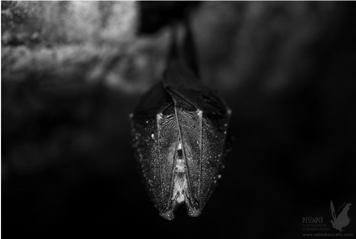
Ratpenat de ferradura petita ( Rhinolophus hipposideros ) hivernant a l'interior d'un refugi.

Com s'ha pogut observar en aquest apartat, les adaptacions dels ratpenats són fascinants i la seva estratègia conservadora —viuen més de 40 anys però tenen molt poques cries al llarg de la vida (segurament menys de 10 arriben a adultes)— provoca que la destrucció d'alguna de les seves colònies impliqui un daltabaix en les poblacions. En aquest sentit la investigació i la conservació són essencials. 11