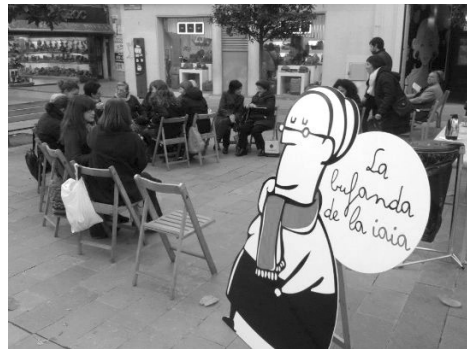
Cadires de vímet de l'associació de comerciants de Granollers Centre.