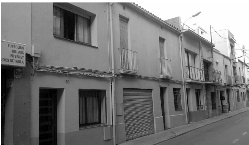
Proposta exemple de millora paisatgística al carrer Ricomà aplicant alguns exemples d'intervencions proposades per la ciutadania.

la ciutadania, com per exemple: garantir la unitat arquitectònica, l'harmonia cromàtica i la coherència dels materials dels edificis i evitar el desordre provocat per elements aliens en façanes i cobertes (OQP 1), potenciar actuacions de millora dels espais públics als barris, fent-los més amables a la ciutadania mitjançant l'ús de mobiliari urbà i la presència de vegetació (OQP 4), o bé intervenir en espais en desús i/o degradats i dotar-los d'usos socials; per exemple, impulsar actuacions d'art urbà al mur de contenció del