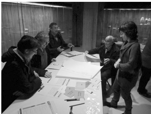
Imatges de la participació ciutadana durant el procés d'elaboració del Pla d'Implicació amb el Paisatge de Granollers.