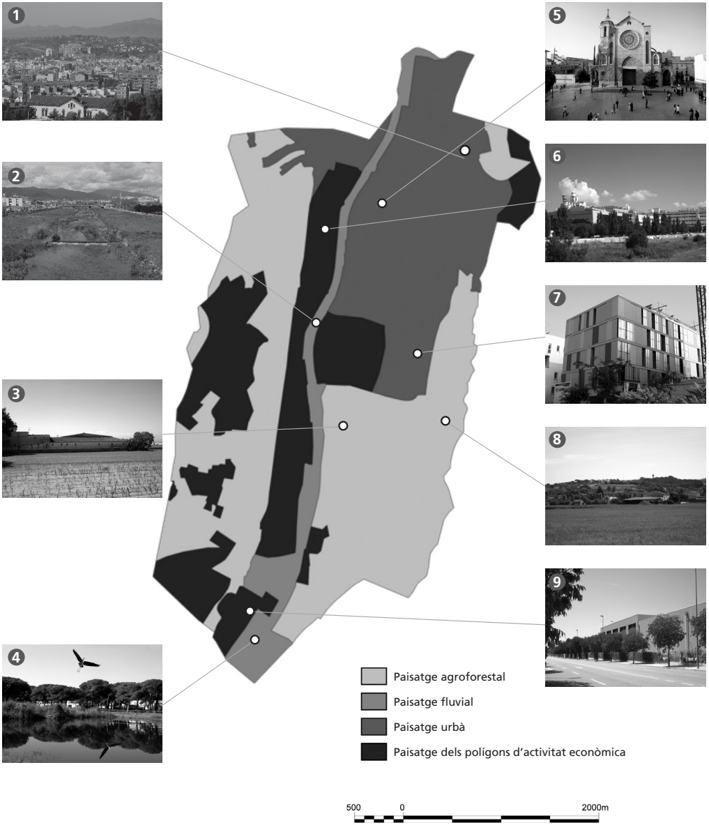
Tipologies de paisatge de Granollers.