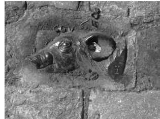
Exemples de tractaments del paviment aplicats a la ciutat de Granollers.