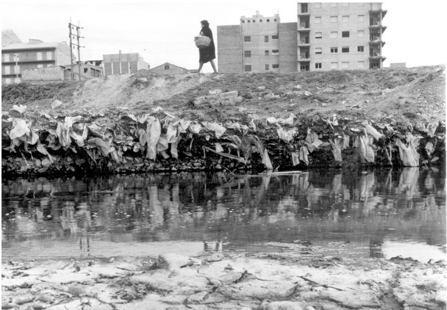
Abocaments de residus municipals a l'alçada de l'actual parc de Ponent (1974).

L'any 2000 s'encarregà a la Diputació de Barcelona una anàlisi dels pous que hi havia a l'entorn de l'abocador i es va constatar la contaminació que per efectes de l'abocador es produïa a l'aqüífer en els punts de mostreig situats més al sud i que presentaven un alt nivell de presència de metalls. Com esmenta la font documental, la profunditat dels solcs, de quatre metres, hauria fet aflorar el nivell d'aigües freàtiques, molt baixes en aquell indret per la proximitat al riu i hauria permès el contacte directe dels residus amb l'aqüífer. També es va sol·licitar a la Diputació un estudi sobre quin era el sistema més idoni per resoldre el problema i tant la Diputació com posteriorment la Junta de Residus de la Generalitat determinaren que la millor solució era el confinament, és a dir no moure els residus de lloc, seguint la directiva europea en aquesta matèria.