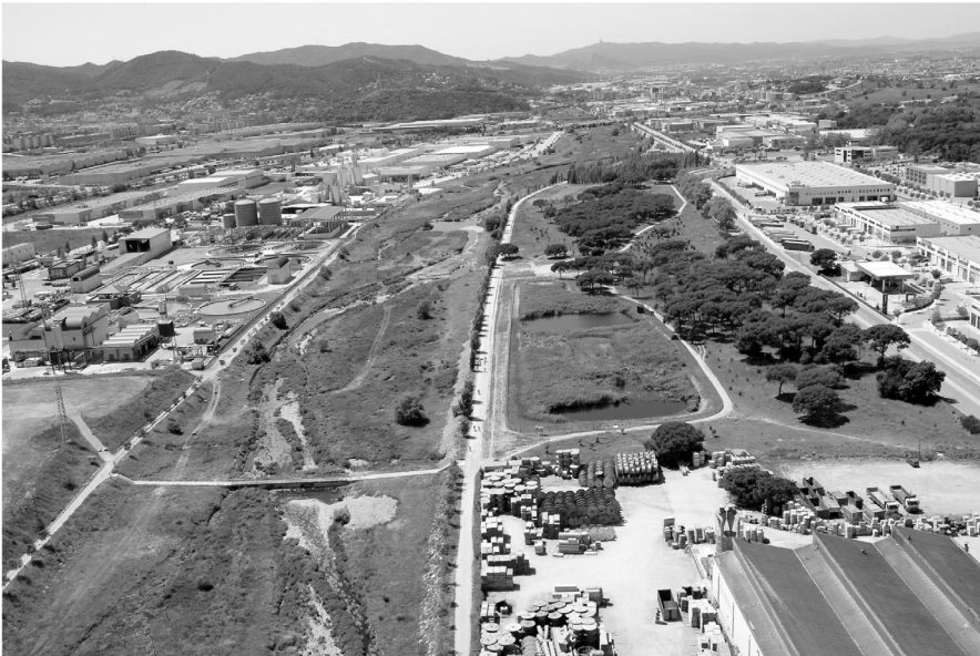
Vista aèria del riu Congost i l'espai natural de Can Cabanyes amb l'aiguamoll.

Un pol ambiental de primer ordre única Catalunya. Al l'extrem sud del terme municipal de Granollers conflueixen instal·lacions ambientals com l'estació depuradora de tractament de les aigües