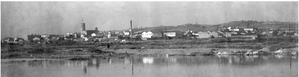
Vista del riu Congost i Granollers al fons (1927).

Des de sempre el riu ha estat condicionat per l'activitat humana, bé sigui per l'activitat agrària, d'aprofitament de l'aigua, industrial o residencial o pel pas de comunicacions viàries. En les fotografies més antigues es pot veure un riu sense bosc de ribera i amb una zona d'hortes important a la ribera. S'hi observa l'aprofitament de les bones terres al·luvials properes al riu per al conreu de l'horta. Terrenys d'horta que a partir de mitjan segle XIX seran en part ocupats per fàbriques i, ja ben entrat el segle XX per les noves àrees residencials. El doctor Salvador Llobet esmentava que el límit de còdols del riu al subsòl es troba aproximadament en l'actual traçat del carrer Princesa, fet que es va poder comprovar arran de la urbanització del carrer Sant Josep.