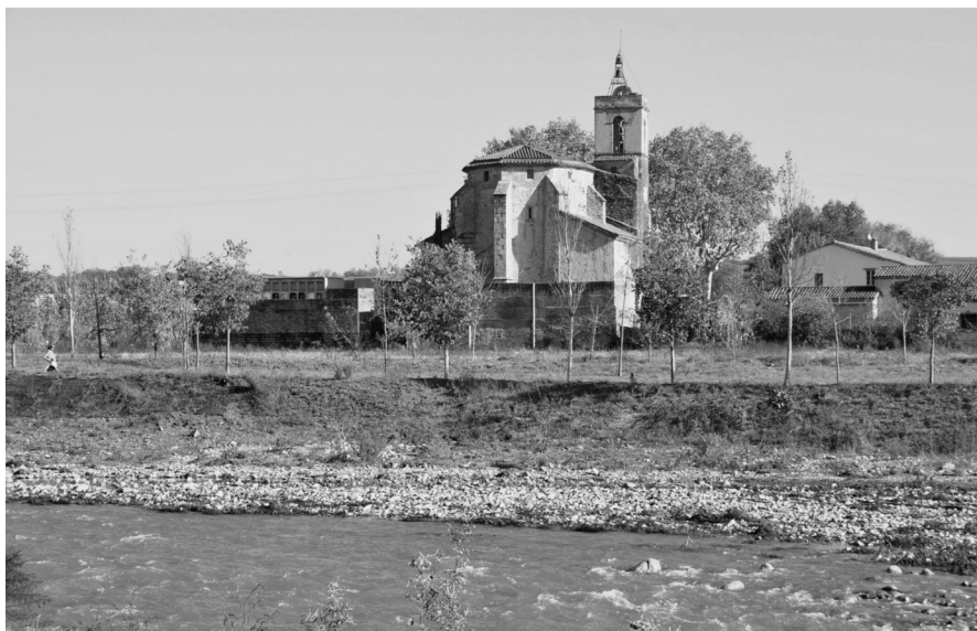
Vista del tram de mur desendegat a l'alçada de l'església de Palou.

retirar estructures hidràuliques en desús, a fi d'eliminar obstacles i facilitar el desplaçament de la fauna aquàtica, i també evitar l'acumulació de residus. Per primera vegada, en el terme municipal de Granollers es va construir una escala de peixos per facilitar la superació de desnivells importants, com és el col·lector d'aigües residuals que travessa el riu Congost i que està situat a uns 200 metres del pont de la carretera Interpolar. Ara bé, l'actuació més emblemàtica va ser la naturalització d'un tram de 603 metres del mur de formigó de la canalització del riu, d'acord amb un projecte hidrogeomorfològic aprovat per l'Agència Catalana de l'Aigua. Es va deixar la base del mur fins a una alçada aproximada d'un metre, es va protegir la base amb escullera de roca i es va recobrir amb terres; els marges van quedar estabilitzats amb tècniques de bioenginyeria. Per tal de garantir la seguretat en cas d'avingudes, es van fer créixer unes motes al passeig fluvial. Aquest projecte tenia per objectiu millorar la connectivitat transversal entre la zona agrària del pla de Palou i el riu Congost per, d'aquesta manera, esdevenir un corredor biològic. L'actuació de desendegament va ser pionera a la conca del Besòs i a Catalunya.