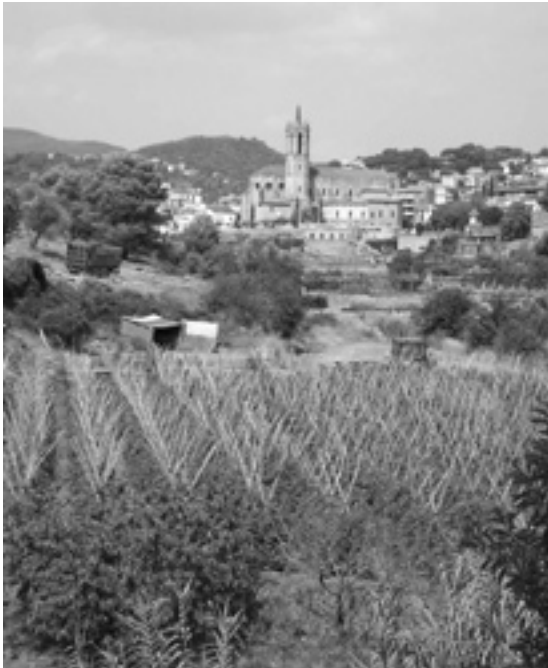
Figura 2. Quatre regadius al Vallès, indrets excepcionals en una comarca de dominància secanera: Caldes de Montbui (agost del 2003), del qual Pere Gil (2002:193) digué al segle XVII que «Las fruytas [...] per ser regades amb aygua calenta son mes primerencas que las altres fruytes dels altres llochs de Cathaluña» i que Zamora (1973:271) qualificà d'«hermosísima huerta» al XVIII. A continuació, una imatge del regadiu associat al pantà de Vallforners, vora la riera de Cànoves (setembre del 2003). En darrer terme, dues instantànies de la llenca regada de la ribera del Mogent: Vilanova del Vallès (agost del 2006) i la Roca del Vallès (juny del 2005). Imatges pròpies.