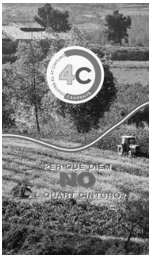
Figura 6. Fulletó dels primers anys de la Campanya contra el Quart Cinturó. La resposta a l'enorme pregunta retòrica és en la pròpia fotografia: diem no al Quart Cinturó pel paisatge agrari característic del Vallès. La realitat agrària s'empra, per tant, com a representació clau enfront d'un determinat projecte que l'amenaça.

de tall agrari i rural quan podria, com es fa gairebé per norma als conflictes territorials a Catalunya, haver recorregut a un referent d'oposició tipus «natura idíl·lica». La Campanya sorgeix els anys noranta, concretament el 1992, amb una primera manifestació el 1994. Com és sabut, s'enceta a Sabadell, a l'entorn de la lluita per la defensa del Rodal (Nogués i altres, 1999) i s'estén pel Vallès amb una certa rapidesa. El pes del «paisatge vallesà» (potser no