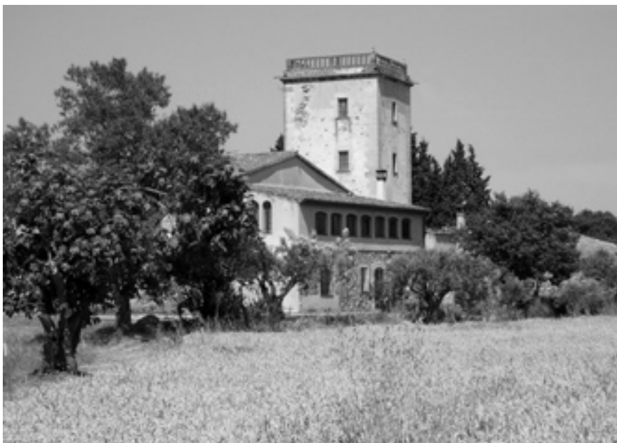
Figura 1. Alguns dels paratges del sud del terme municipal de l'Ametlla del Vallès, el juny del 2004. Imatges pròpies.