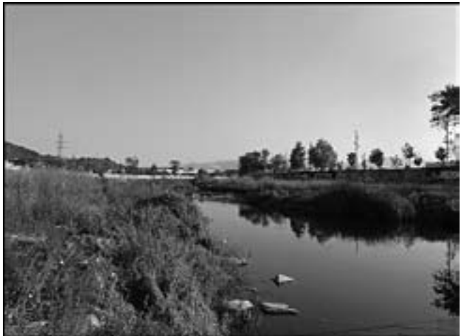
Fig. 2. El riu Congost a Granollers

Ja fora de l'Espai Natural de can Cabanyes, però sense perdre interès biològic, ja que condiciona la fauna d'aquest, trobem el riu Congost (fig. 2). Les espècies més abundants són la polla d'aigua ( Gallinula chloropus ) i l'ànec collverd ( Anas platyrhynchos ), encara que hi podem trobar, en menor abundància, altres espècies: el bernat pescaire ( Ardea cinerea ), fàcilment localitzable a l'hivern, el martinet blanc ( Egretta garzetta ) i gran diversitat d'aus passeriformes com ara la cadenera ( Carduelis carduelis ), el trist ( Cisticola juncidis ) o el repicatalons ( Emberiza schoeniclus ), que ens visita a l'hivern. Respecte a la vegetació del riu, hi podem trobar dues zones clarament diferenciades: els herbassars i el canyissar. Als herbassars es situen arbres com el pollancre ( Populus nigra ), l'om ( Ulmus minor ) o el salze ( Salix alba ), arbustos com l'esbarzer ( Rubus ulmifolius ), tomateres ( Solanum lycopersicum ) i diferents plantes herbàcies.