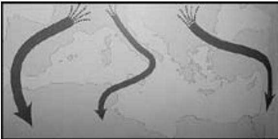
Fig. 3. Principals rutes migratòries de les espècies europees

La migració de qualsevol espècie animal consisteix en el desplaçament de llarg recorregut amb l'objectiu principal de trobar aliment, i no per fugir del mal temps, ja que la majoria d'espècies estan adaptades a aquests canvis de climatologia. A la primavera i l'estiu, els biomes temperats són molt més productius que a l'hivern. Per tant els moviments migratoris es situaran a la primavera i a la tardor, principalment. Adaptades a les necessitats de cada espècie, podem trobar diferents tipus de migració: estival, hivernant, parcial (quan una població d'una espècie sedentària augmenta amb l'arribada d'exemplars a l'estiu o a l'hivern), de pas (espècie present en un territori solament durant els moviments migratoris), en llaç (espècie present solament durant un dels moviments migratoris) o altitudinal. Aquest últim tipus de migració és típic d'espècies alpines i consisteix a descendir d'altitud a l'hivern, per tal d'evitar la neu, que els impedeix accedir a les poques fonts d'aliment que hi ha a l'època.