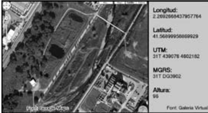
Fig. 1. Localització exacta de l'espai natural de can Cabanyes

Centre d'Educació Ambiental, on es duen a terme diverses activitats educatives, i també informació sobre el lloc, una zona de pícnic i diversos panells informatius en diferents punts de la zona.