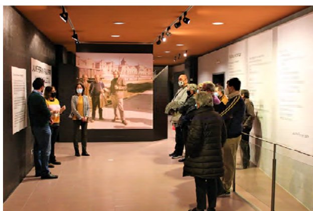
Visita guiada a l'exposició del Museu de Cervera.