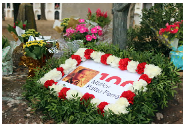
Ofrena floral al cementiri de Montblanc.

El matí del dia de l'aniversari dels 100 anys, va tenir lloc una ofrena floral per part de la família de Palau Ferré al cementiri de Montblanc, on descansa l'artista. També per la festivitat de Tots Sants, la tomba del pintor es va omplir de flors per homenatjar la seva trajectòria.