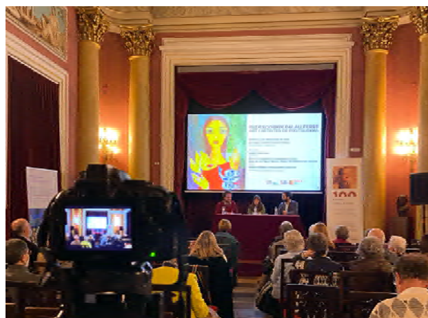
Els Amics del Liceu redescobreixen Palau Ferré.