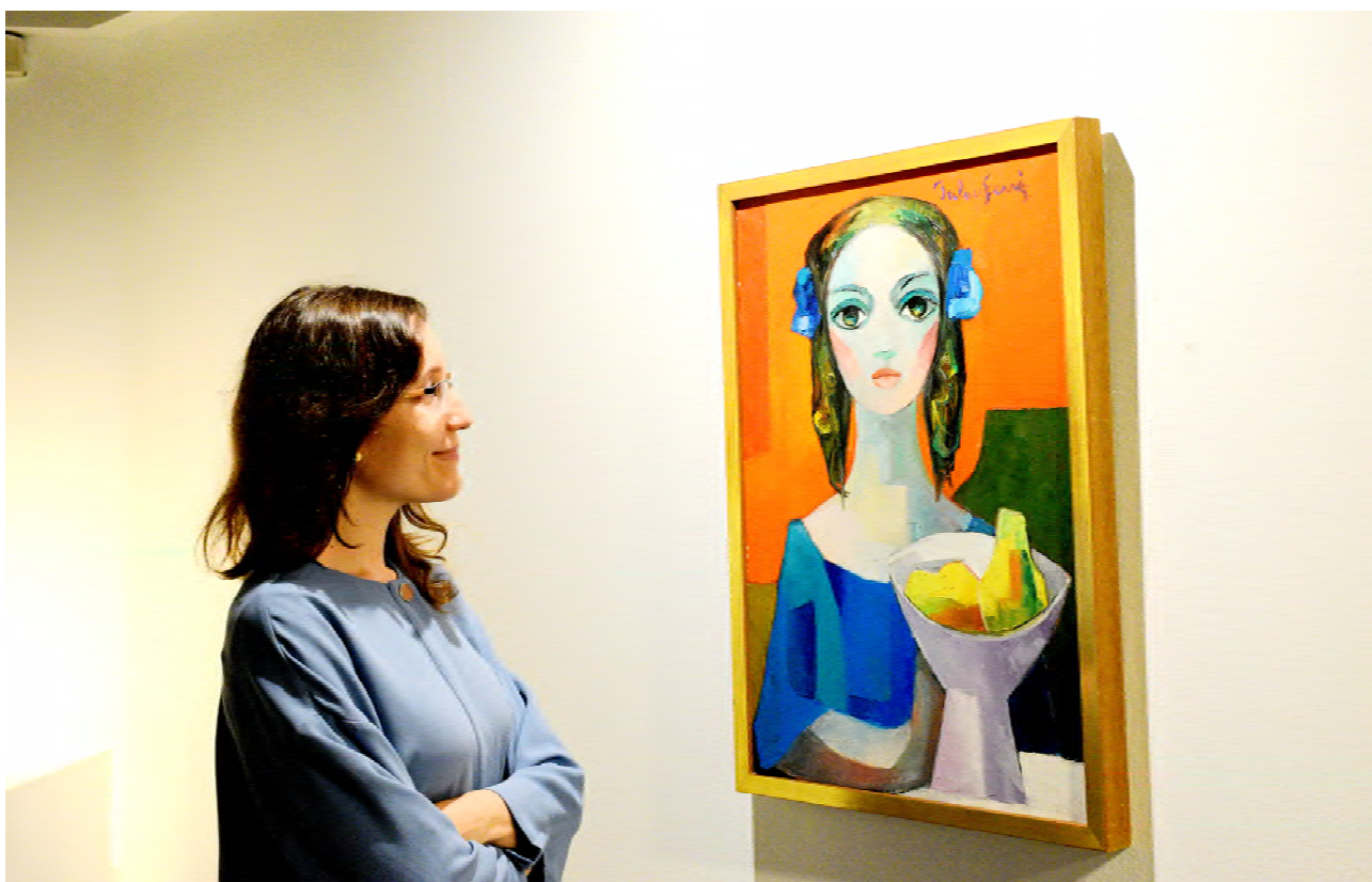
L'exposició de l'Institut d'Estudis Ilerdencs.

Les nombroses exposicions i actes de l'Any Palau Ferré continuen al llarg del primer semestre del 2022 per tal d'acabar de complementar el conjunt de la commemoració amb actuacions especialment destacades com la mostra "Palau Ferré. Compromís artístic", promoguda pel Servei de Biblioteques de Catalunya i que itinera per les biblioteques públiques, o exposicions com "Palau Ferré. Vincles essencials", a través de la qual l'Institut d'Estudis Ilerdencs ofereix als visitants, del 23 de febrer al 3 d'abril de 2022, una panoràmica de les connexions lleidatanes del pintor.