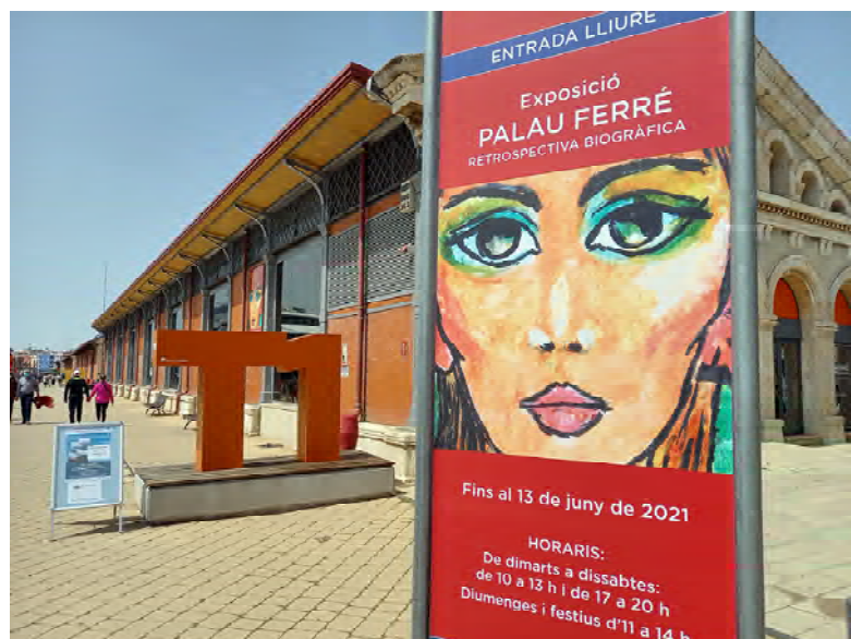
Retrospectiva biogràfica al Tinglado 1 del Port de Tarragona.

de 900 metres quadrats amb grans formats a partir dels quals tothom podria fotografiar-se dins de les pintures de l’artista.