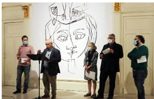
Inauguració de l'exposició al Centre de Lectura de Reus.

El 2020 va ser un any ple de preparatius per tenir-ho tot a punt pel centenari de Palau Ferré. El Museu d'Art Contemporani de Vilafamés va presentar un bodegó primerenc exposat de manera permanent en una de les sales de la institució valenciana; el Museu de la Vida Rural de l'Espluga de Francolí va incloure una tinta xinesa de l'artista a l'exposició "Jugar amb foc"; el Centre de Lectura de Reus va dedicar-li, a la Sala Fortuny, l'exposició "Art i Valors de Palau Ferré", centrada en les col·laboracions que l'artista havia fet amb diverses ONG; i es va donar a conèixer el mural que il·lustra la primera escola inclusiva de Vicente Ferrer a Anantapur (Índia).