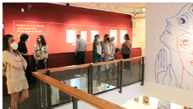
L'exposició del Museu d'Art de Girona.