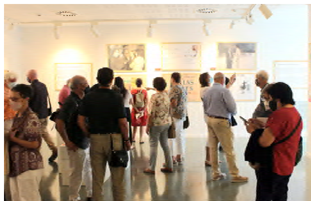
L'Exposició de Santa Coloma de Farners.