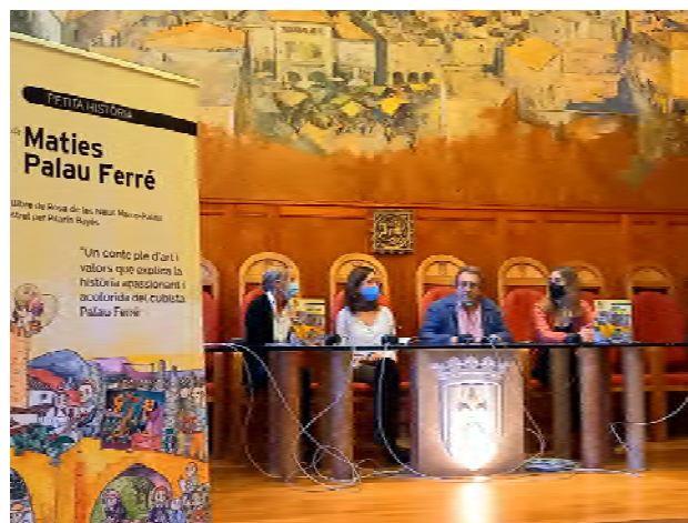
Roda de premsa de presentació de la Petita Història de Palau Ferré.