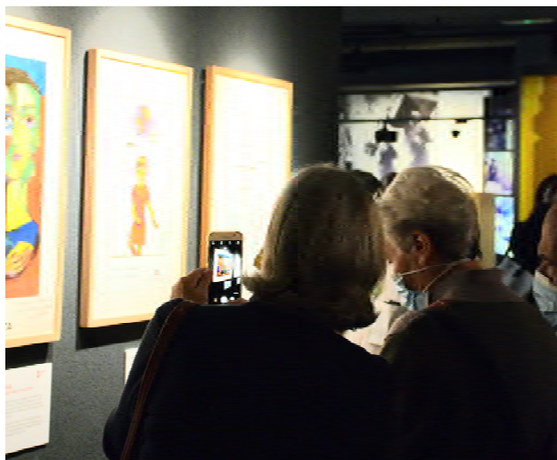
Un moment de l'exposició Palau Ferré. Compromís social al Museu d'Història de Catalunya.