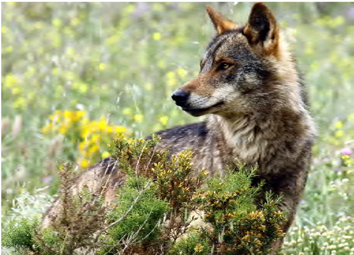
El llop ( Canis lupus ) abans era ben present a la Conca de Barberà.

Antigues rondalles explicaven que, durant les carlinades del segle XIX, els llops, junt als corbs i les àligues havien donat bon compte dels cadàvers i dels ferits d'aquell conflicte, especialment durant l'emboscada