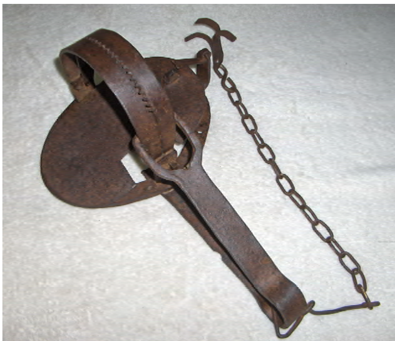
ENGIO00188. Les pitges, braons o rateres que forjaven els ferrers eren un recurs ben cruel per atrapar animals. S. XIX.

Les Muntanyes de Prades constituïen a l'època medieval una barreja de territoris de diversa jurisdicció i senyoriu: per una banda coexistien alguns termes pertanyents al territori del Camp de Tarragona, on hi tenia l'arquebisbe de Tarragona el senyoriu eminent, per infeudació en alou efectuada pels comtes de Barcelona; el rei d'Aragó i comte de Barcelona, com a successor dels Bordet, prínceps de Tarragona, tenia, al mateix temps, territoris en feu per l'arquebisbe de Tarragona 6 . La reina Sanxa, muller d'Alfons I, per via de dot (1187) també havia fruit de les rendes de Siurana i el seu terme 7 (bona part de les Muntanyes de Prades), essent-ne senyora entre el 1196 i el 1208. El mateix rei Pere II "El Gran" disfrutà de les rendes de les Muntanyes de Prades 8 i de Montblanc quan era infant, per donació que li féu el seu pare Jaume I, el 1263. Tanmateix, serà en temps de Jaume II, l'any 1324, quan s'erigirà el "Comtat de Prades" i es reprendrà la jurisdicció eminent (mer i mixt imperi) sobre el territori, malgrat les protestes i plets presentats pels senyors aloers 9 .