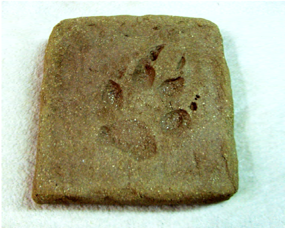
CESPM00011. Reproducció d'una petjada de llop en una rajola de gres.

L'actual àmbit de les Muntanyes de Prades separa les terres tarragonines del litoral amb la planície lleidetàna, limitant a l'oest amb les serres de la Llena, el Montsant, el Priorat; al sud amb l'estret de la Riba, la serra de l'Investida, així com part de les comarques de l'Alt i el Baix Camp; a l'est limita amb les valls de l'Anguera, el Gaià, així com amb l'Alt Camp i la serra de Miramar; al nord, la serra del Tallat,