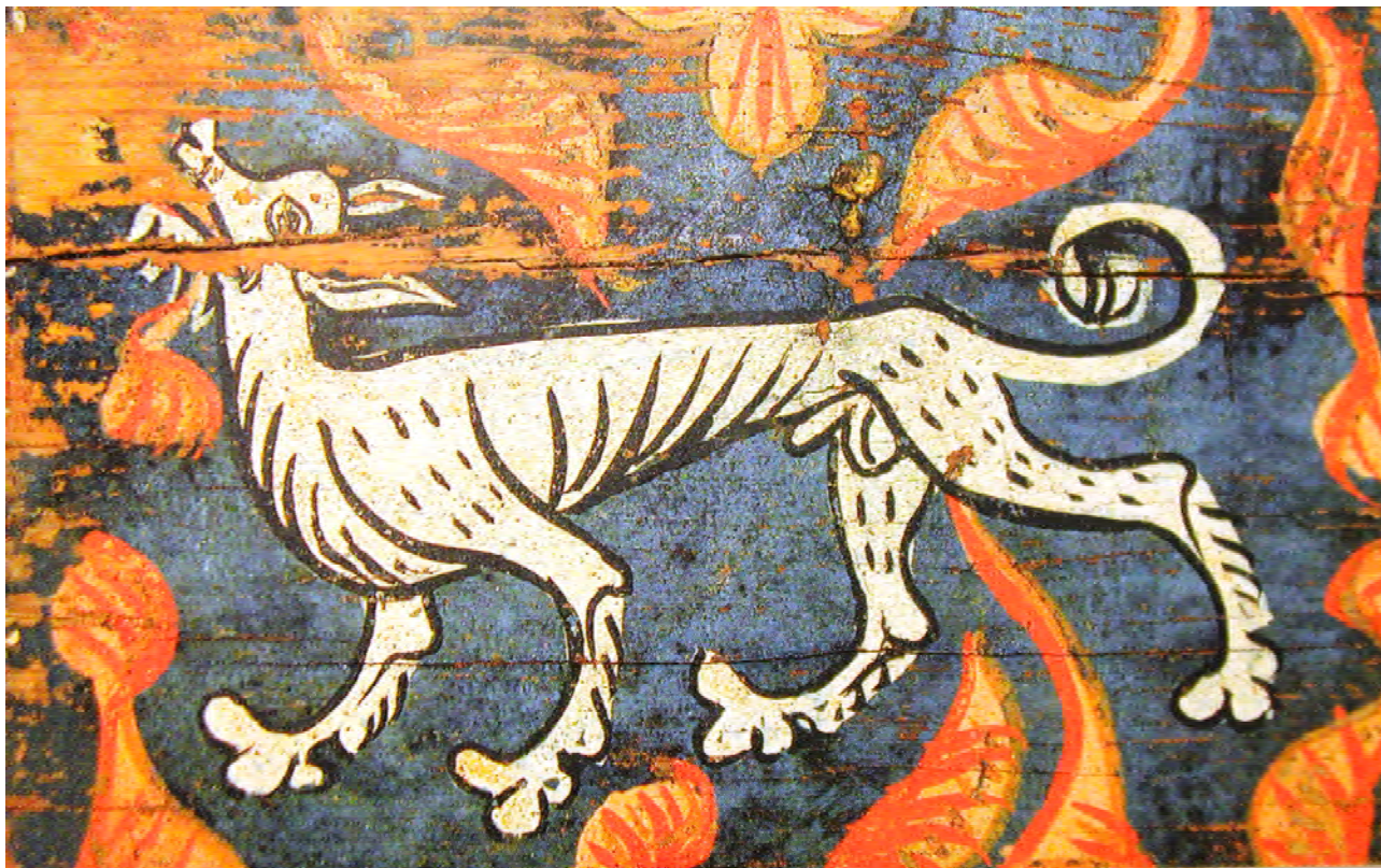
Figura d'un llop al teignat de l'església de Sant Miquel de Montblanc (inici del s. XIV).

dels Motllats, indret proper al terme de Montblanc i més enllà de Mont-ral, dirigida pel "Nen de Prades" contra les tropes del coronel Francesc Picazo 2 .