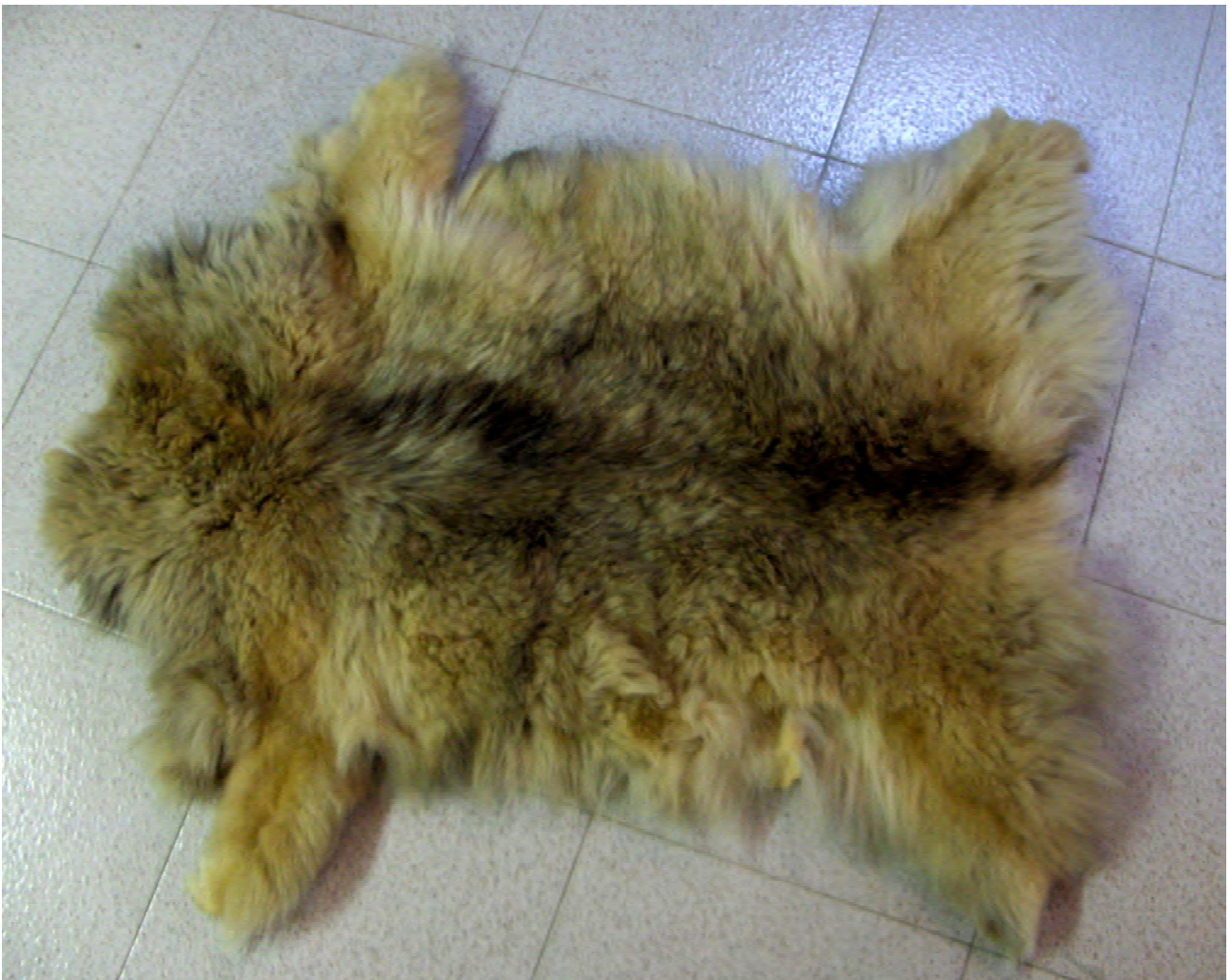
ENGIB00022. Pell de llop. Per a cobrar recompenses i evitar fraus les autoritats feien presentar el cap i/o les potes de l'animal.

carnalatge o dret per gravar-los, com pretenien els recaptadors de l'impost anomenat "carnatge de Siurana"; per altra banda, els montblanquins també podien pasturar, apletar i abeurar, de dia i de nit, tota mena d'animals grossos i menuts al bosc del Monestir de Poblet, als llocs dits Pineda Vella i Pineda Nova sense, però, entrar a les deveses que rodejaven les granges que el Monestir explotava en exclusiva d'empríus. Els animals havien d'anar assenyalats amb marques per poder identificar-los en cas d'incomplir les normes que dictaven les concòrdies, com constava a la concòrdia més important que fou signada i compromesa el 1352 entre el municipi montblanquí i l'abat i convent del Monestir de Poblet 10 . Els habitants de Prades també disposaven de certs drets sobre el Bosc de Poblet a l'hora de conduir-hi els seus ramats, gràcies a una altra concòrdia signada amb l'abat i el convent pobletà 11 . Els espluguins, sense tantes prerogatives, també en podien fer ús, però, amb moltes limitacions. En conjunt, aquestes dades ens permeten fer-nos una idea aproximada de l'abundosa presència de ramats a la zona muntanyenca durant el període medieval, i del perill que la proliferació de llops podia comportar en el rendiment que els pastors i propietaris del bestiar pensaven obtenir de la seva explotació.