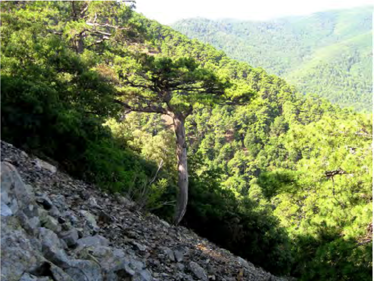
Exemplar de pinassa de 369 anys.

Es pot extreure també que la mitja d'edat de tots els arbres inventariats, que no vol dir del Bosc de Poblet, ni tampoc de l'inventari anterior dels arbres de més de 70 cm. de diàmetre normal, sinó només de les mostres dels arbres que han estat escollits, a més de singulars, potencialment vells, per a posteriorment fer una cronologia de referència. Així, l'edat mitja de tots els arbres mostrejats, és d'uns 219 anys aproximadament.