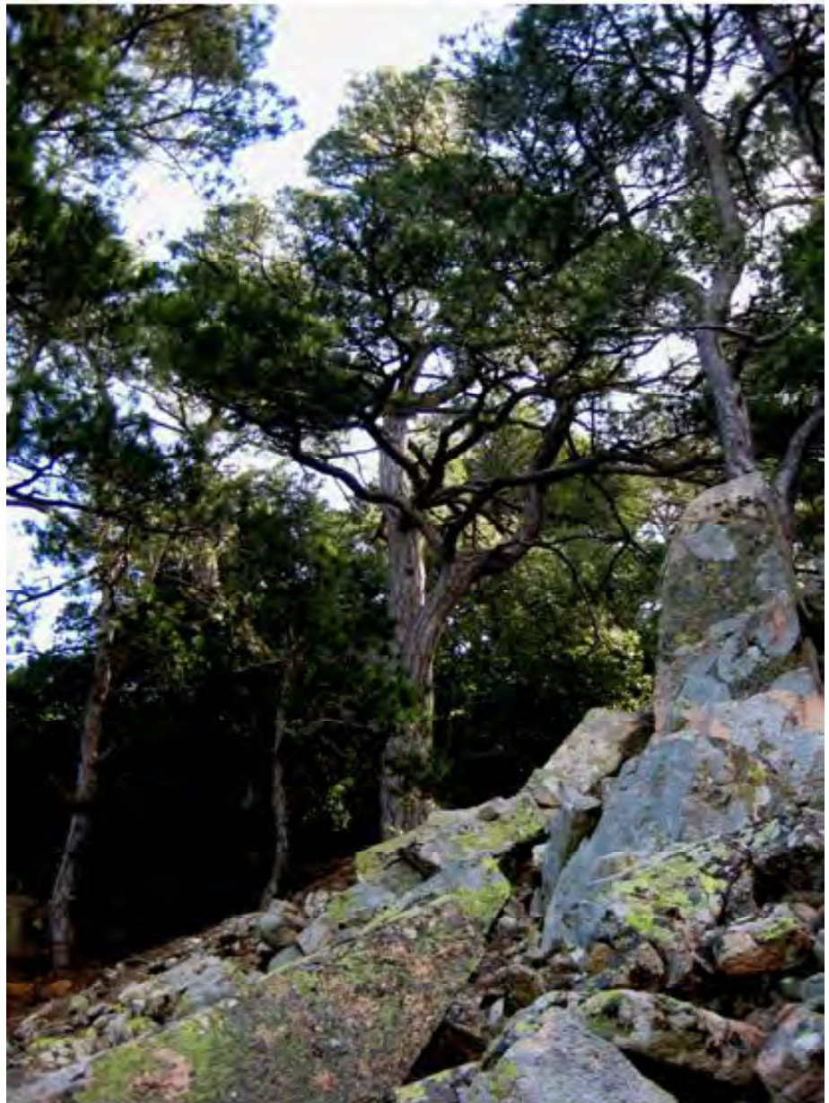
Exemplar de pinassa de 461 anys, el més vell.