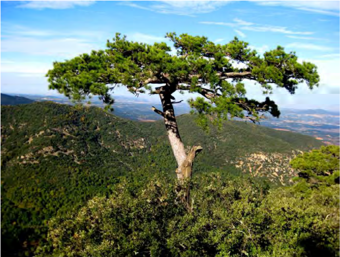
Exemplar pinassa de 402 anys, es poden observar algunes de les branques tallades amb destal i l'afectació d'un llamp.

Sobre la base d'aplicar l'ordenació de 1946, des de 1948 fins 1963 s'extreuen 13.032,198 m 3 de fusta de coníferes. S'adapta l'estudi de l'estat econòmic, la planificació de l'ordenació i el pla d'aprofitaments quinquennals de fusta. En l'aprofitament forestal del bosc alt de coníferes, tot i que s'estableix com a diàmetre extratallable el de 35 cm., es preveu deixar uns 200 peus de reserva per ha i de classes diametral superior a 35 cm.