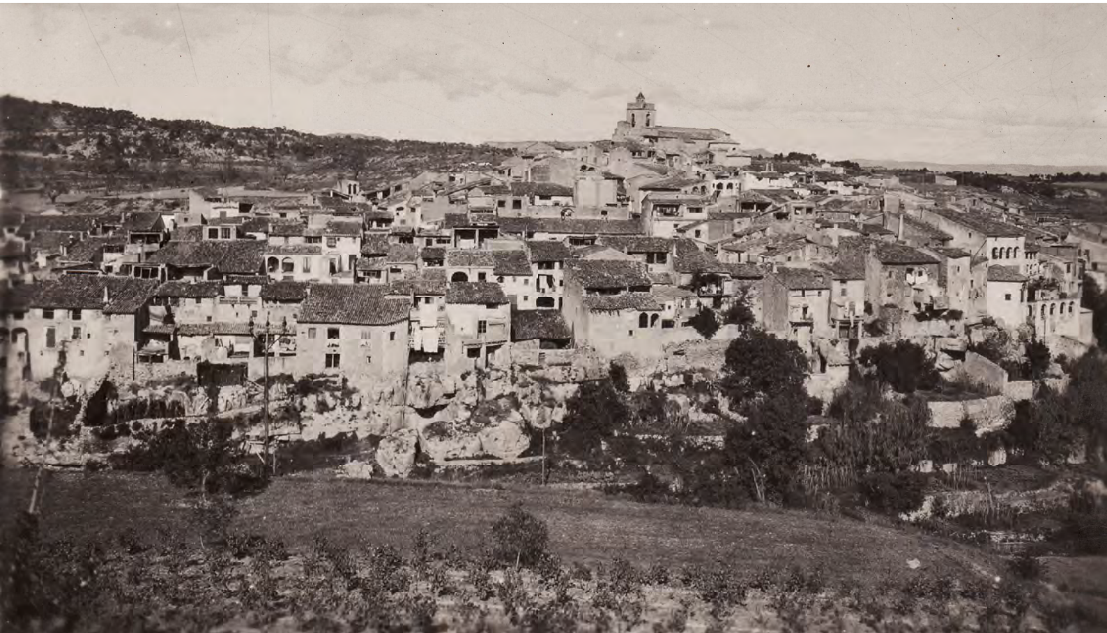
Panoràmica de Vimbodí, captada en la dècada dels anys vint per Mn. Pau Roselló (arxiu fotogràfic Alfons Alsamora, Vimbodí)