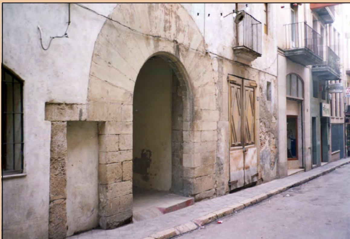
Entrada posterior de l'Hospital de l'Espluga, abans de ser restaurada

i havia tingut capella, fins que fou destruïda el 1936. El 1567, el pare del primer carlà de Cabestany, i hereu de Jaume Figuerola, que també s'anomenava Francesc Bou, féu esculpir un escut d'armes del llinatge, col·locat al centre del llindar de pedra de la casa. És una figura d'un bou llaurant. Es tracta, per tant, d'un escut parlant. Tanmateix, no té cap mena de validesa jurídica, en el sentit que acrediti un títol de noblesa.