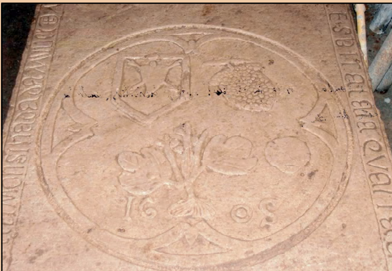
Les fulles de figuera, heràldica de Jaume Figuerola

Els Bou tenien la casa pairal al carrer de la Font, prop de l'eixida de la vila per on discorre el riu Francolí. Encara avui, conserva notables parts de la casa d'època medieval,