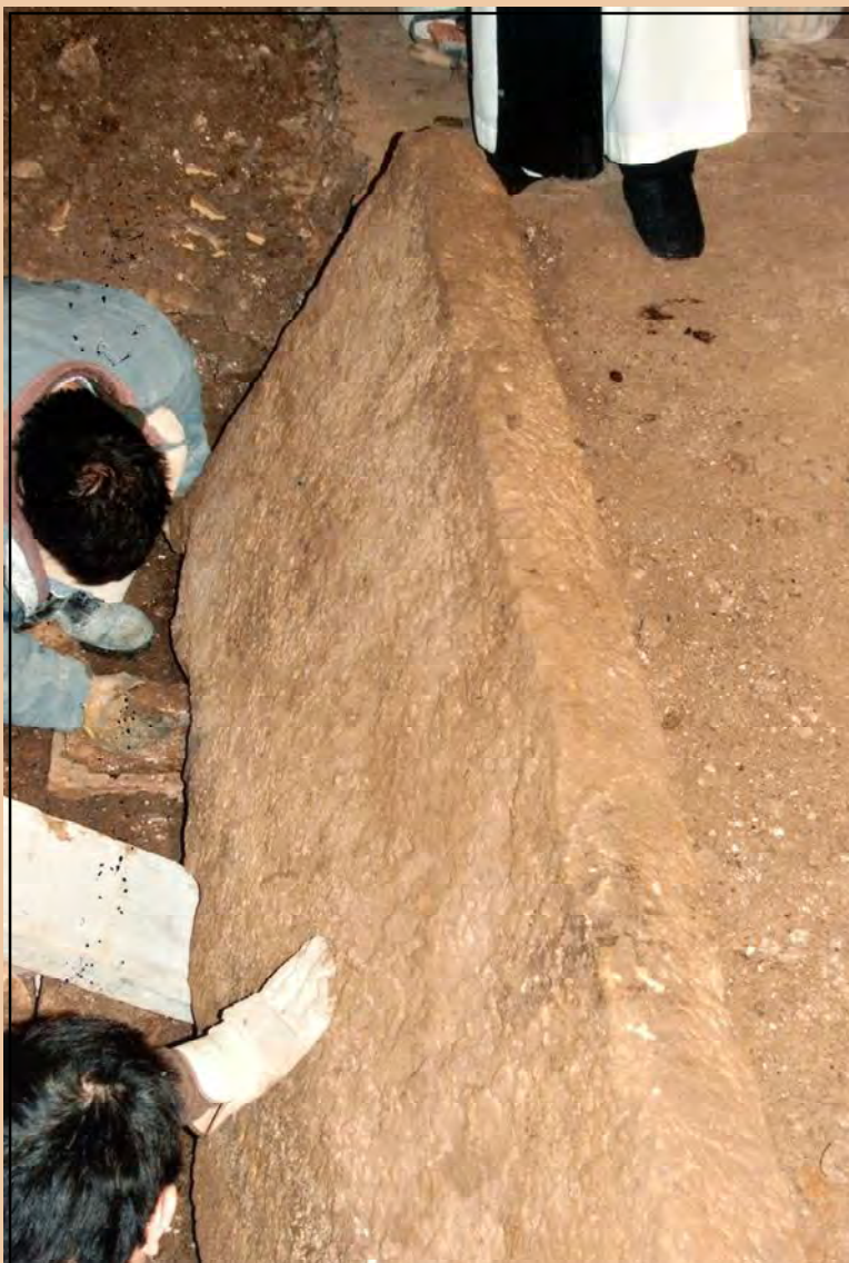
Moment de desenterrar la llosa dels Figuerola i Bou (2006)