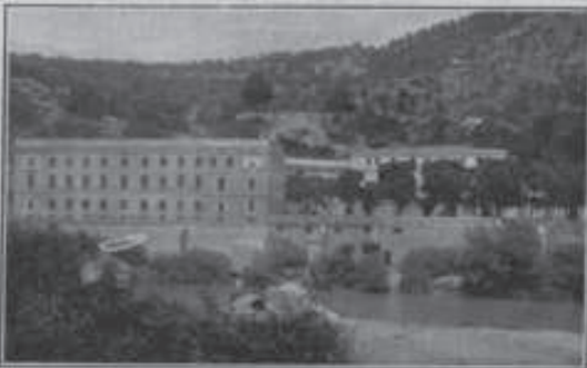
El balneario de la Puda de Montserrat