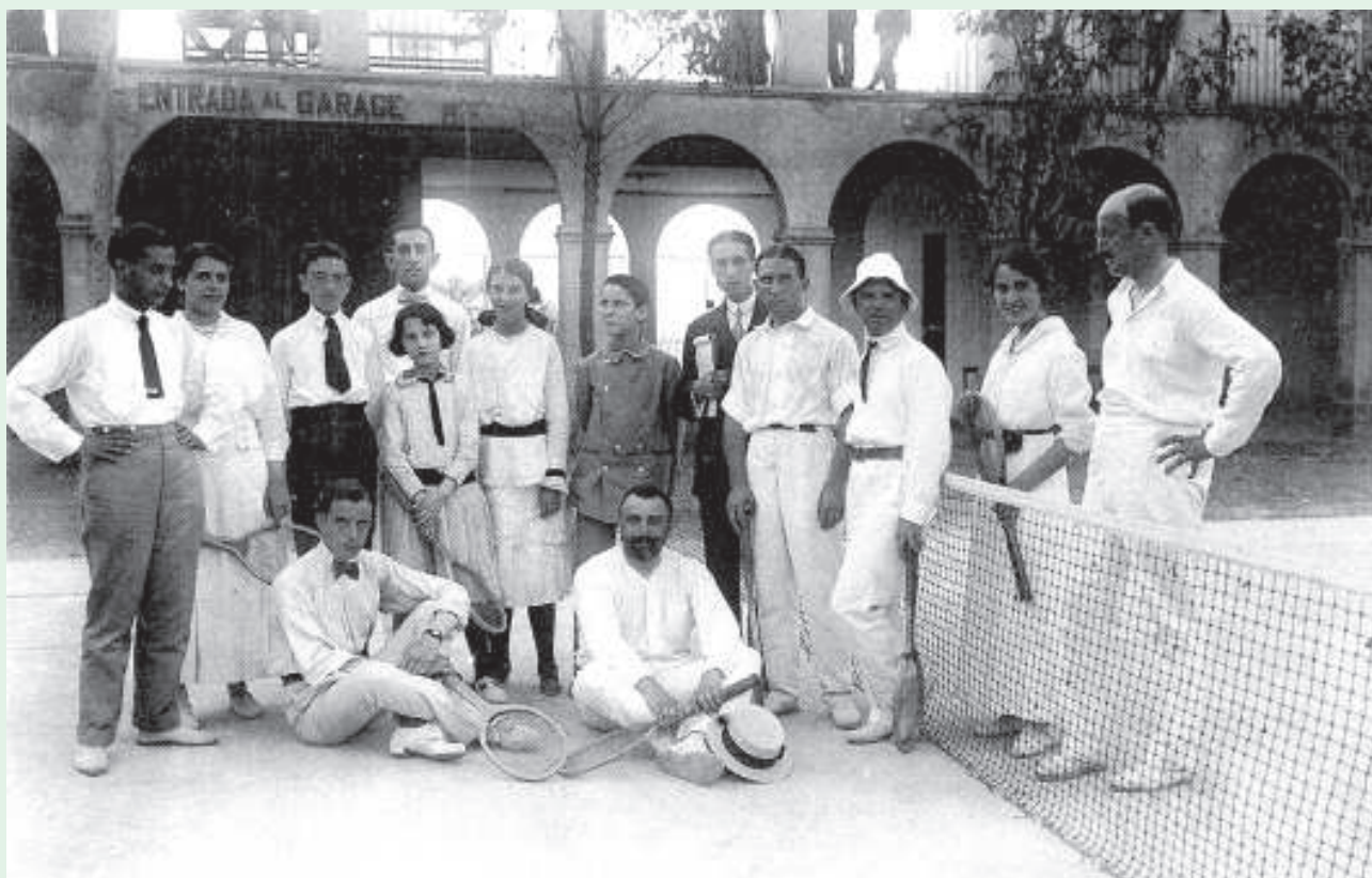
Pista de tennis a la plaça porxada de Vil·la Engràcia el 1916 amb participants en el campionat. Membres de la família Roca Bellver i Pau Casals (amb gorra blanca) (Museu de la Vida Rural. L'Espluga de Francolí).