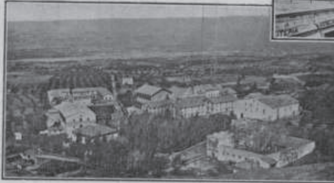
Vista general del balneario de la Espuga de Francolí

El balneario de la Puda de Montserrat es también reconocido como el más indicado contra las afecciones artríticas, herpéticas, escrofulosas, reumáti-