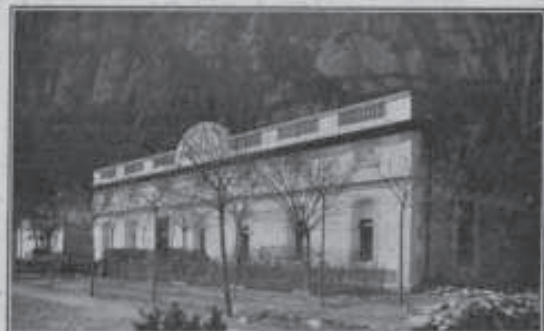
El hotel restaurant Marçel