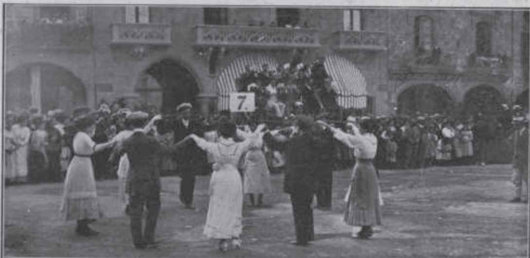
Una de las collas bailando la típica danza catalana ante el jurado