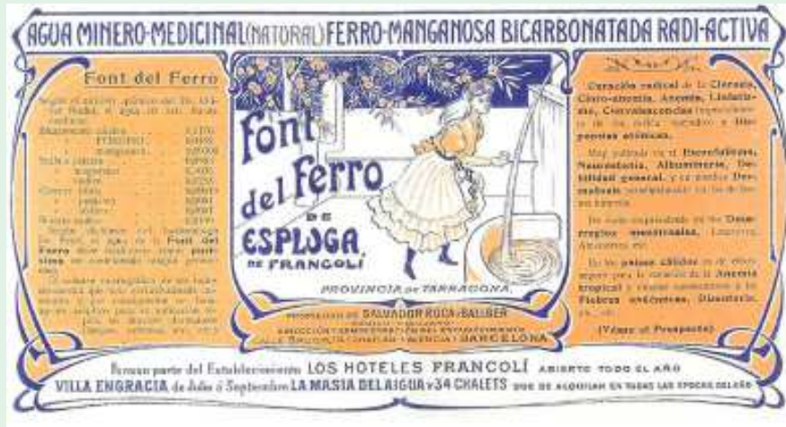
Etiqueta per a l'embotellament de l'aigua de la Font del Ferro (Col·lecció particular de l'autor).