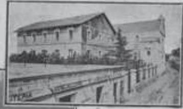
Hotel e Iglesia del balneario

cas y sífilicas, de la piel y de las mucosas, erupciones de todas clases, úlceras crónicas, laringitis, catarros bronquiales y enfermedades de la matriz.