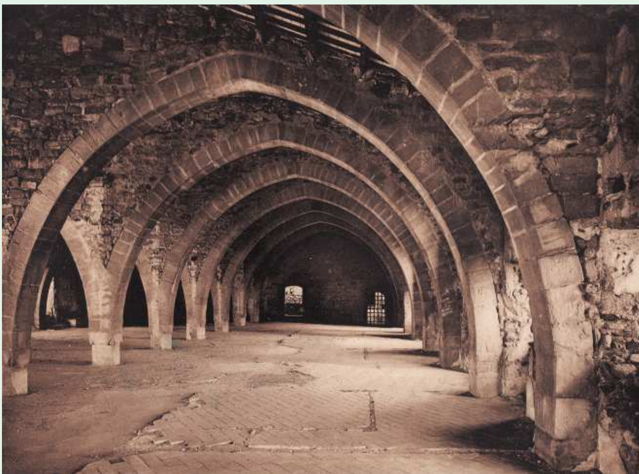
Dormitori dels llecs. Autor desconegut, 1900? (Arxiu i col·lecció Alfons Alsamora i Jiballí).

Encapçalem aquest epígraf en plural, doncs al Monestir de Poblet, a l'Edat Mitjana, i també als segles moderns (amb les seves lògiques modificacions o adaptacions) regien, bàsicament, dos tipus d'horaris diferents, que correspondrien, també aproximadament, als mesos d'hivern i a les mesades estiuenques. Aquesta diferenciació, no obeïa, però, al fet d'adaptar-se a les diferències climàtiques, en absolut. Es tractava, un cop més, d'aplicar amb escurpulositat la regla de Sant Benet que, a banda de fer respectar rigorosament tots els resos de l'ofici diví, tant