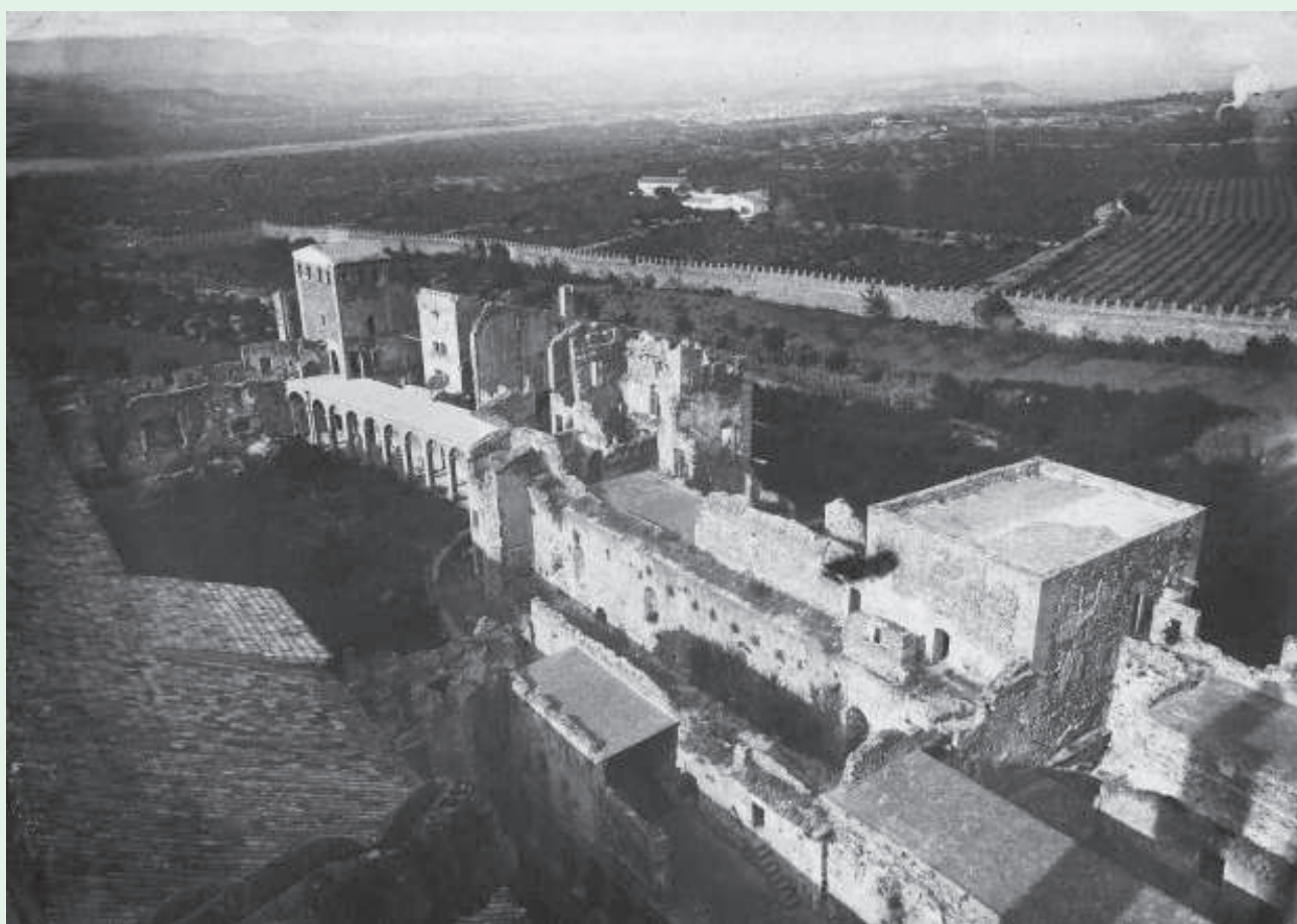
Zona de Poblet anomenada «Les cases noves». A la instantània es veu com encara resten dempeus algunes torres de la muralla, manada bastir per Pere III, al s. XIV

A més a més, a l'hivern, els monjos estaven exposats, dins dels grans edificis del mateix clos de Poblet, a incessants corrents d'aire fred, doncs no totes les estances tenien les portes adequades, com ens ho pot fer pensar encara avui dia. Per exemple, els grans finestrals del