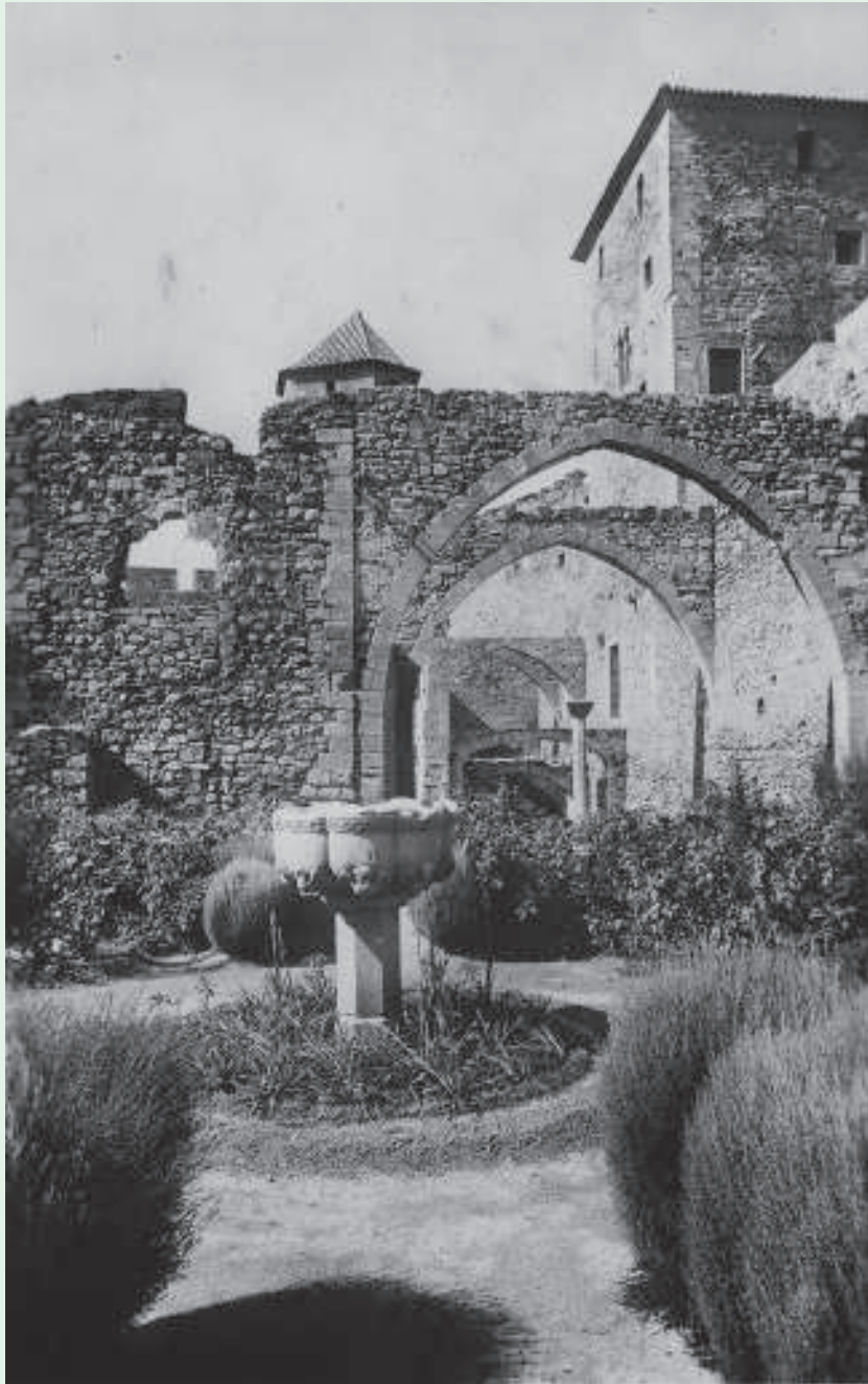
Brollador del claustre. T. Postals en bromur. Edicions Tallers Zerkowiz fotogràf. IV (Arxiu Alfons Alsamora i Jiballí).

Poblet, doncs, malgrat la seva alta distinció social, no s'escapava, en tots aquests aspectes, als costums més arrelats de la societat medieval. I totes aquestes pèssimes condicions higièniques eren proclius a l'extensió de malalties infeccioses de tota mena, i àdhuc a epidèmies més o menys greus, que assolaven la comarca i el país. A Poblet, a l'estiu, eren freqüents unes afeccions de les anomenades terciànes, que donaven febre, i que eren propagades per mosquits nascuts a l'entorn de basses o tolls d'aigua. Aquestes passes estan documentades a l'època medieval i a la moderna.