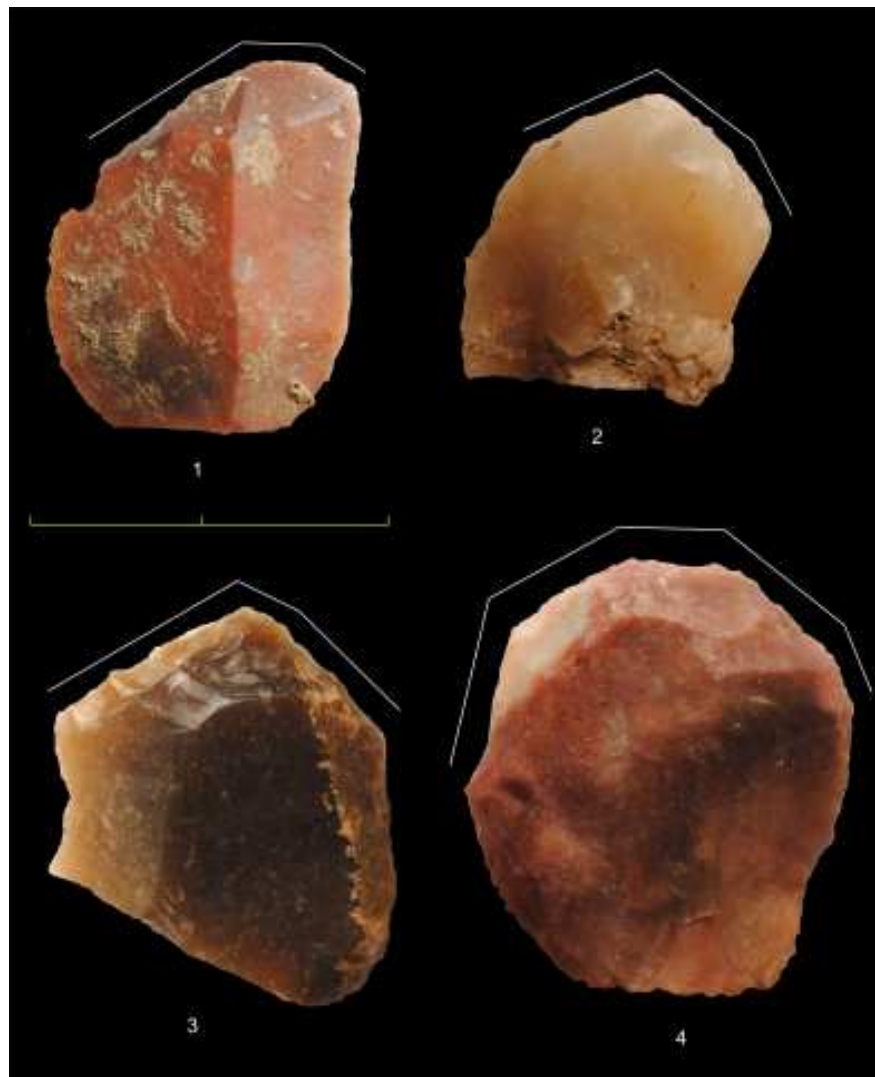
Figura 3. Gratadors retocats després de l'exposició al foc.

Pel que fa als útils simples, els gratadors són el grup tipològic més nombrós (37,4%), seguits dels elements de dors (19,4%), dels denticulats (12,5%) i de les ascles retocades (12,4%). La resta d'útils (abruptes, burins, perforadors, rascadores i truncadures) mostren freqüències més baixes. Hi ha peces cremades a tots els grups tipològics (Taula 2). Si considerem només els artefactes retocats després de l'exposició al foc, alguns grups tipològics tenen percentatges similars als que assoleixen al conjunt de les peces retocades, però altres mostren diferències significatives. Els elements de dors són el segon grup més important en el conjunt de la indústria, però només representen un 3% de les peces retocades després de l'alteració tèrmica. Les ascles retocades mostren la tendència contrària, ja que el seu percentatge entre les peces retocades després de haver estat cremades és sensiblement superior (24,7%) al que tenen en tot el conjunt.