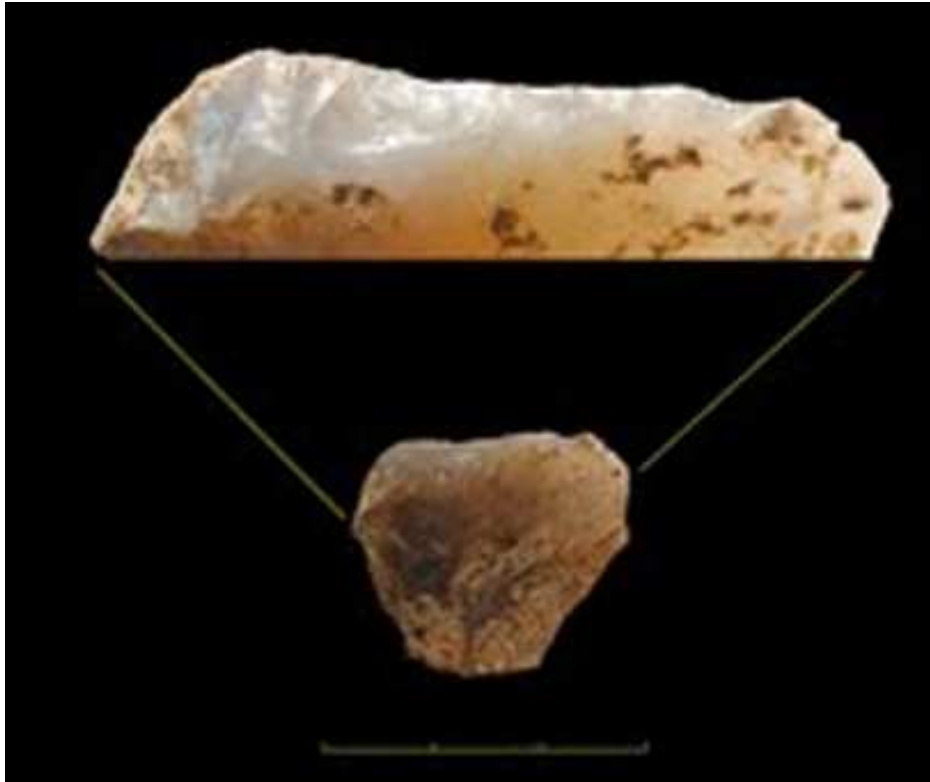
Figura 1. Gratador retocat després de l'exposició al foc. Ampliació de la vora retocada en la qual es pot apreciar el llustre greixós característic dels retocs posteriors a l'alteració tèrmica.

Els artefactes retocats han estat analitzats i classificats d'acord amb la Tipologia Analítica i Estructural de G. Laplace (1972), encara que només la seva adscripció segons els principals grups tipològics ha estat emprada en aquest treball. Tanmateix, hem inclòs un grup tipològic que no apareix a la Tipologia de Laplace, el de les ascles retocades. Aquest grup inclou els artefactes que han estat retocats, però no mostren les morfologies estandarditzades que caracteritzen la resta dels grups tipològics. Hem prestat una atenció especial a la distinció entre els útils simples – és a dir, els artefactes que presenten només un tipus d'útil – i els útils múltiples, que mostren diferents tipus configurats sobre un mateix suport. Cal dir que hem considerat un dels tipus de gratadors definits per Laplace – el gratador amb retoc lateral – com un útil múltiple, ja que presenta dos costats retocats amb característiques diferents.