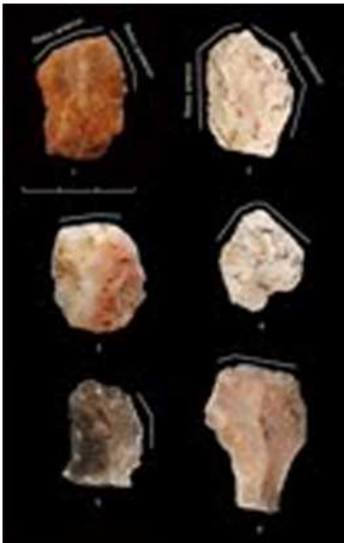
Figura 2. Útils retocats després de l'exposició al foc. Les línies blanques indiquen la localització dels retocs. 1, 5. Ascles retocades. 2. Gratador amb retoc lateral. 3, 4, 6. Gratadors. 1 i 2 foren retocats tant abans com després de l'alteració tèrmica.