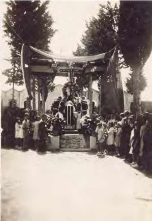
FOTO 28 Inauguració del panteó, l'any 1941, sense la làpida dels enterrats, que fou col·locada el dia 12 de febrer de 1942