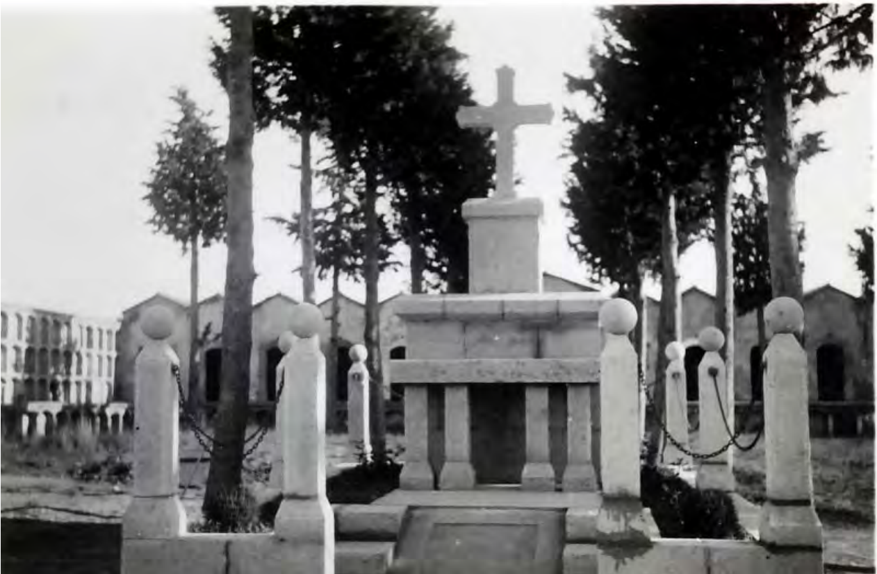
FOTO 29 El panteó preparat i a punt de la seva inauguració l'any 1941