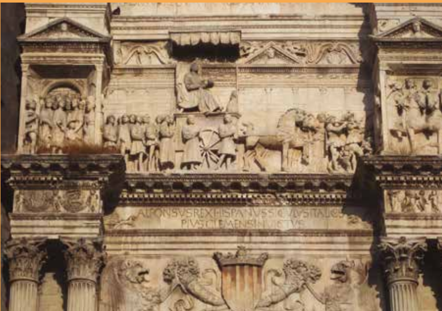
Detall d'Alfons el Magnànim al Castell Nou de Nàpols.

Tots aquests fets, clarament allunyats del dia a dia d'un habitant qualsevol de la València de mitjan segle XV, no restaven desconeguts per la majoria de la població. O, almenys, eren notícies que, d'una forma o altra, tenim constància que circulaven per les places i els carrers de la València del tres-cents i el quatre-cents. Una altra qüestió, lògicament, és el grau d'assimilació d'aquesta informació en circulació. Ara, però, ens centrarem en la posada en circulació d'aquestes notícies, carregades d'intencionalitat i d'ideologia,