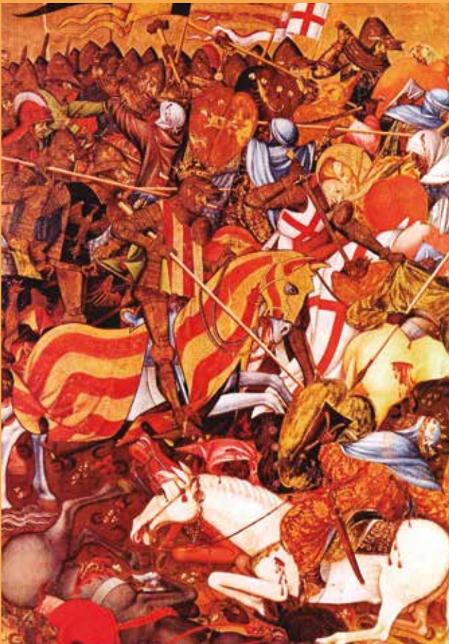
Detall del retaule del Centenar de la Ploma.

Aquesta mena de crides considerem que són les més interessants, ja que permeten conèixer de quina forma el poder polític, en aquest cas el de la monarquia i l'Església, a través del consell de la ciutat de València i la Seu, influïa sobre la