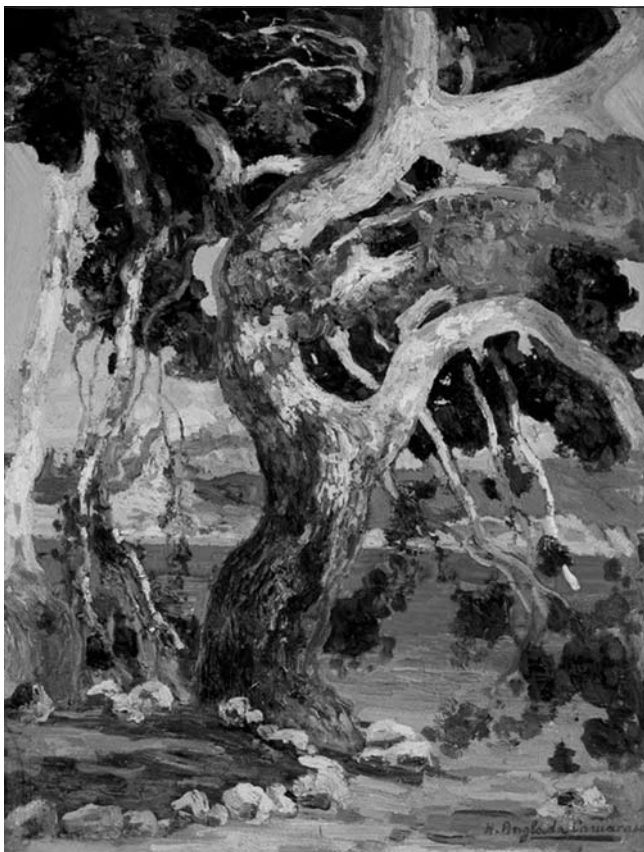
El Pi de Formentor (ca. 1922), d'Hermen Anglada-Camarasa.

ca d'admiració turística es combinava amb la identificació amb el paisatge natural propi.