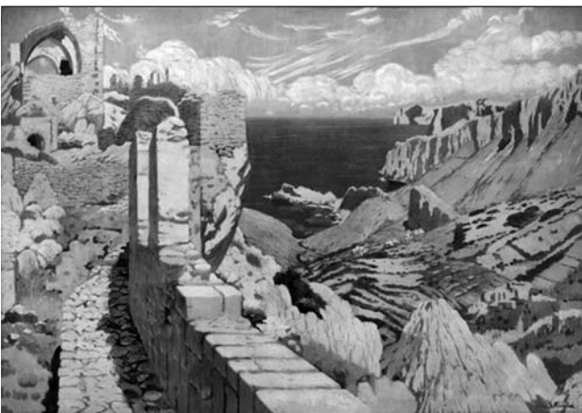
El castell del rei (1902), de Santiago Rusiñol, instal·lada com a plafó al menjador del Gran Hotel de Palma