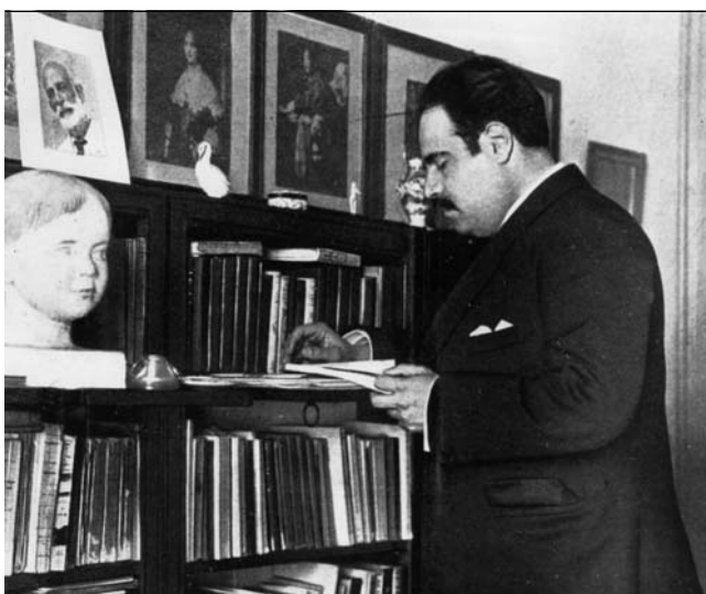
Eugeni d'Ors a la seva biblioteca

Pel que fa a sectors culturals concrets, l'actuació en l'àmbit de les biblioteques fou especialment brillant, amb la creació de la Xarxa de Biblioteques Populars i l'organització de la Biblioteca de Catalunya i de l'Escola de Bibliotecàries. Però