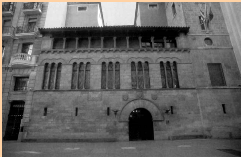
La Paeria de Lleida, s. XVIII

jove de la Lleida de l'alcalde Fuster durant la dècada de 1860. Aleshores el romanticisme dominava el discurs polític i cultural de la generació dels liberals progressistes del Trienni de 1840-1843 i del Bienni de 1854-1856, que durant els anys 1860 havien moderat el seu ímpetu, però no el seu projecte urbà sobre Lleida. Pleyan és el testimoni també del Sexenni Democràtic de 1868-1874. El 1868 escriurà una memòria per al foment de Lleida i el 1873 donarà a conèixer els seus Apuntes de historia de Lérida . 3