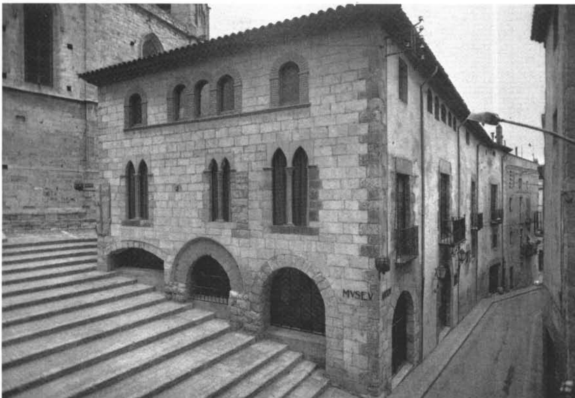
El Museu-Arxiu de Montblanc i la Conca de Barberà, en una imatge retrospectiva.

– Crec que el tret definidor de la història local és l'àmbit espacial, no una temàtica específica. Crec que cal demanar una transferència ordenada de coneixements cap a la història supralocal, sense oblidar