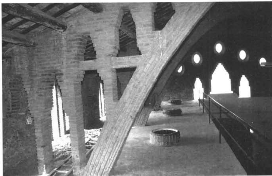
Interior del celler de Nulles, situat damunt les tines.

l'abast, i com a moviment que ha perdurat al llarg de tot el segle XX. Per proximitat física, ja que a molts pobles hi havia cooperatives i potser encara n'hi ha; pel fet que es pot abordar des de diversos enfocaments científics amb problemàtiques diverses; i sobretot per comprensió d'uns valors que reforcessin l'arrelament dels seus avantpassats i, per extensió, els seus, i que sovint es treballen inconnexos. L'aprenentatge cooperatiu, com a valor de valors de la demo-