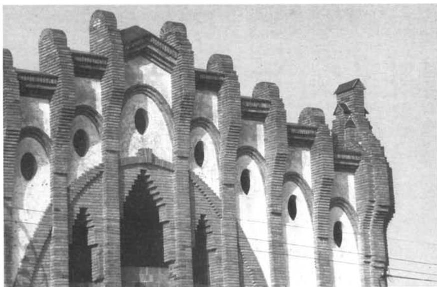
Detall de la façana exterior del celler de Nulles.

dre, la Reforma ha optat per unes Ciències Socials àmplies, no subjectes únicament a la Geografia i a la Història, tot i ser les ciències predominants de l'àrea. Altres ciències com la Sociologia, l'Antropologia, l'Economia i la Política, participen d'aquest projecte en interrelació.