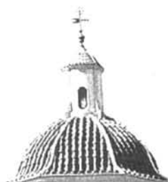
Campanar de Santa Justa i Santa Rufina, al municipi d'Oriola, al Baix Segura. La parròquia fou construïda el segle XIV i modificada el segle XVIII.

nal i defensiva de la zona fou duta a terme per Jaume II, qui va posar les bases de la implantació i el desenvolupament posterior, tant del règim municipal valencià com de l'administració territorial de la futura Governació d'Oriola durant l'època foral a aquestes terres meridionals valencianes. 4