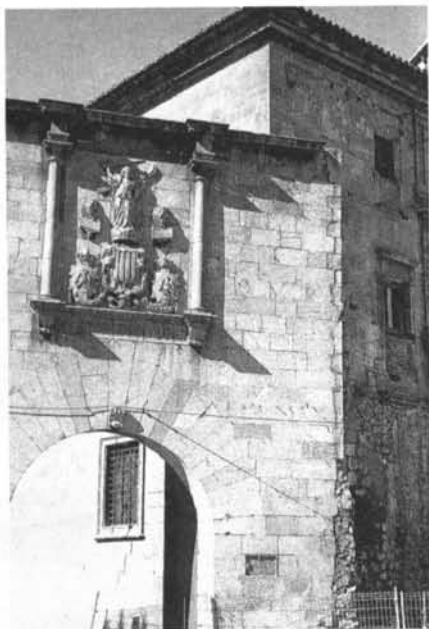
Porta de la ciutat d'Oriola, de mitjan segle XVI, amb els símbols del braç reial de les Corts Valencianes.

Enfront d'aquest panorama del sector agrari, essencial per al manteniment d'una població, d'altra banda, cada volta millor alimentada i en una onada d'augment demogràfic, la indústria –sobretot la de draps, les bases de la qual s'havien posat a mitjan segle XIV– assolí, en alguns indrets com Oriola, un lloc destacat. La tendència es donava a tot arreu del País Valencià: les manufactures de llana es van consolidar a la darrereria del segle XIV i al segle següent, en un cicle de producció urbana i rural amb una relativa concentració i especialització. 8 La indústria tèxtil oriolana, però, hagué de competir dins d'aquest sector capdavanter amb nuclis de la Corona d'Aragó i de l'Occident europeu –com ara València, Perpinyà, Florència, Flandes, etc.– en un terreny, els draps d'alta qualitat, que