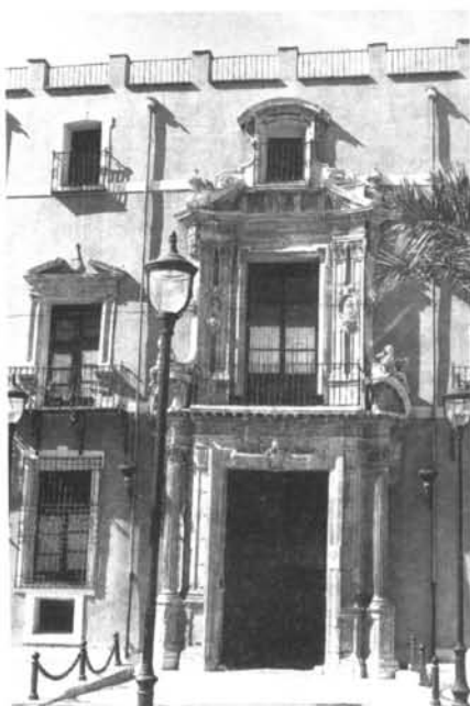
Porta del palau dels Rocamora-Rossell (marquesos de Rafal) a Oriola, del segle XVII.

els paraires oriolans no van arribar a produir. L'evolució de la indústria tèxtil estigué, doncs, condicionada en bona mesura per aquests factors externs, alhora que per la incapacitat de la producció d'aquest territori per superar els reptes i elevar-ne la qualitat.