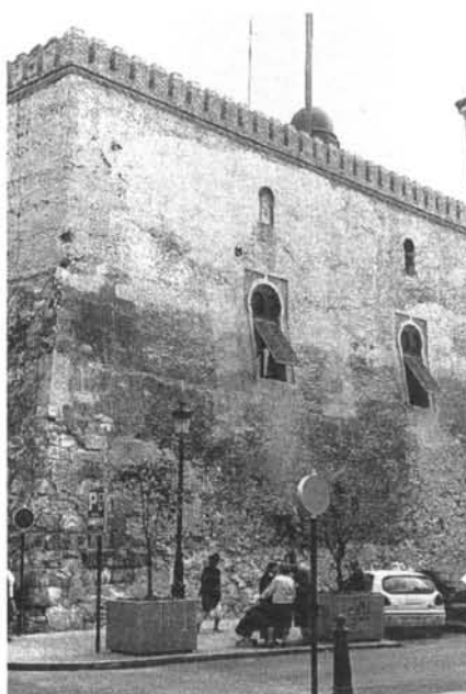
Vista de «La Calaforra», una de les quatre torres angulars de les muralles islàmiques del centre d'Elx.

El control de l'espai feudal, de localitats amb un terme molt ample, va recaure en centres emmurallats i fortificats. Eren els casos d'Oriola, Alacant i Elx, probablement amb una baixa densitat en l'àmbit rural, pels que s'escampaven petits llocs i alqueries —com ara La Daia—, dependents del Consell i de la noblesa local. Això reflectia el predomini de l'estament militar i ciutadà que ostentava l'hegemonia política, econòmica i social. Sobre aquesta extensa superfície, que enquadrava els recursos i els homes, les oligarquies integrades per un nombre reduït de llinatges exercien el seu poder des dels òrgans del Govern local, emplaçats al centre urbà. 3 L'organització institucio-