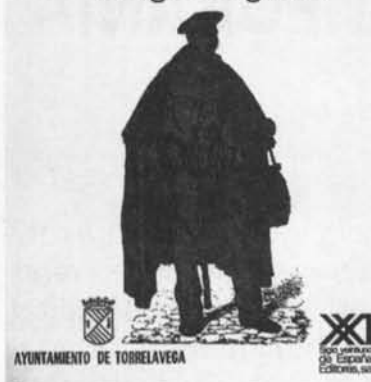
Portada del llibre de Vicente Fernández Benítez sobre el carlisme a Cantàbria, publicat el 1988.

bre de Pedro Reques Velasco, Población y Territorio en Cantabria , publicat el 1998. L'educació o les institucions benèfiques o la cultura del lleure eren temes completament nous i que de mica en mica s'incorporaven a l'anàlisi del comportament social. 9 També era nou ocupar-se del pensament científic, com van fer Fernando Salmón, L. García Ballester y J. Arrizabalaga en una obra que estudiava el primer intent d'implantar un sistema hospitalari modern, La Casa de Salud Valdecilla. Orígenes y Antecedentes , publicada el 1990. Més que una simple investigació erudita sobre la història de l'hospital més emblemàtic de la regió, era una anàlisi de l'ambient científic i cultural del Santander del començament del segle centrat en la figura de López Albo i en la col·laboració que el seu projecte va trobar en el marquès de Valdecilla. De la mateixa manera que M. Eugenia Calabuig havia obert la recerca sobre la figura del doctor Madrazo a El regeneracionismo en Santander. Doctor Madrazo , publicat el 1993 i que ara s'amplia amb l'estudi introductor de M. Suárez Cortina a Enrique D. Madrazo. Escritos sobre ciencia y sociedad , publicat el 1998, la figura dels germans González de Linares ha estat rescatada d'un oblit injustificat pels treballs de Benito Maradiaga sobre Augusto i per l'estudi introductor de Leonor de la Puente a l'obra de Gervasio, Una visión del mundo ganadero montañés . 10