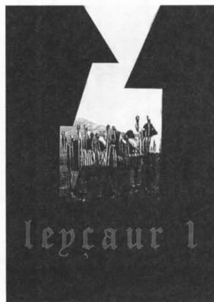
Reproducció de la portada del primer número editat de la revista Leyçaur.

En l'ordre teòric, epistemològic i comparatiu no podem eludir l'organització de cinc seminaris europeus i la publicació de les ponències en la col·lecció European Local and Regional Comparative History Series de la Universitat del País Basc: Anglaterra, Itàlia, Suïssa,