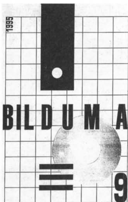
Portada de la revista Bilduma, la qual ha contribu t a la producci  de la hist ria local d'Errenteria.