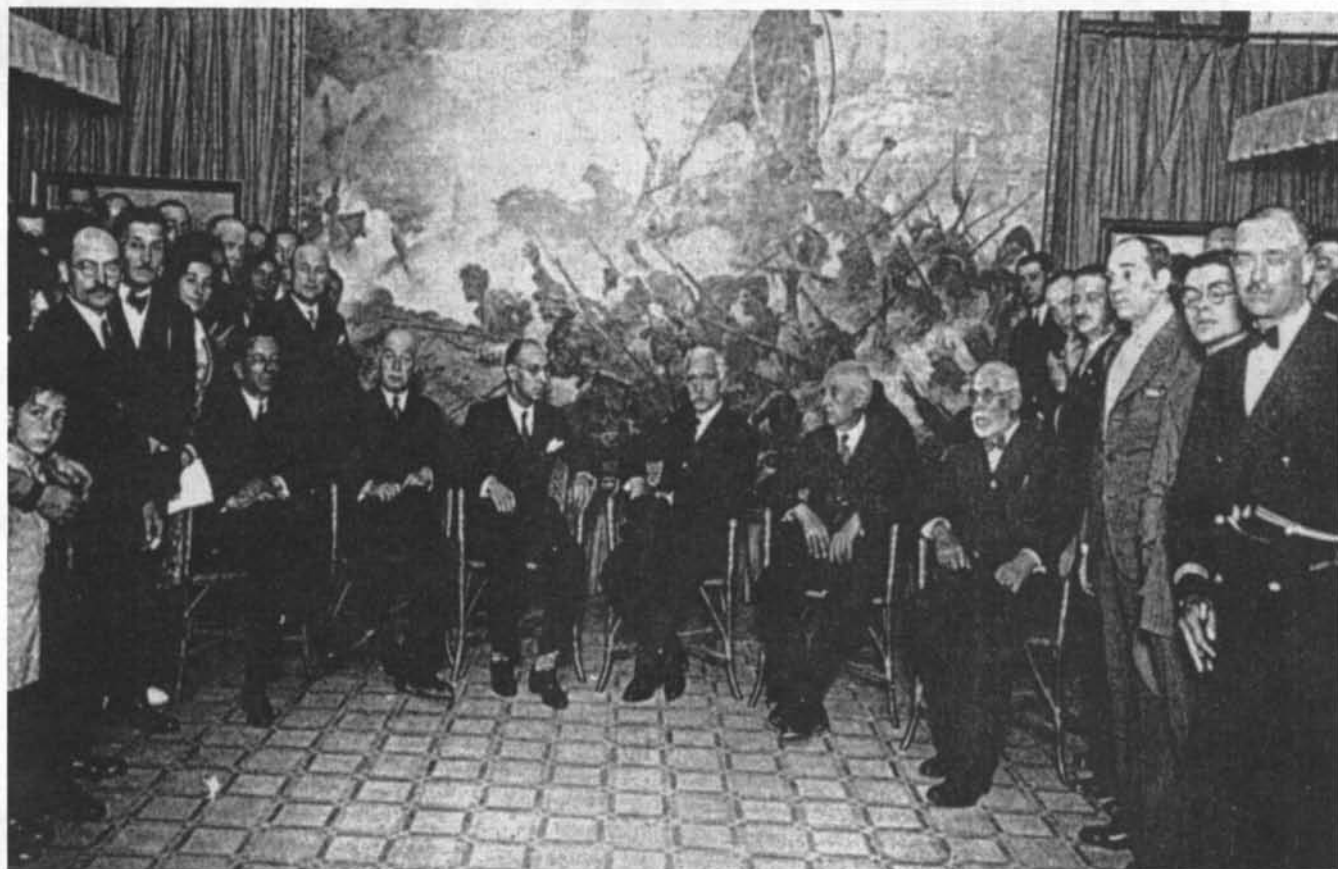
Francesc Macià amb l'alcalde de Sabadell a la Sala d'Actes de l'Acadèmia de Sabadell el 28 de maig de 1932.

tre els socis que acceptin el règim, el màxim ideal de la Schola: popularització de la pietat litúrgica, difusió del cant gregorià, no es fa referència a cap qüestió política ni social. La revista respondrà, doncs, només a activitats religioses, en els articles de pietat.