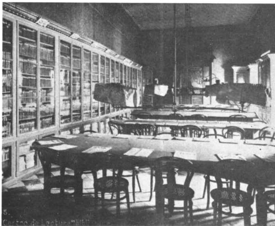
Biblioteca del Centre de Lectura de Reus, al principi de segle.