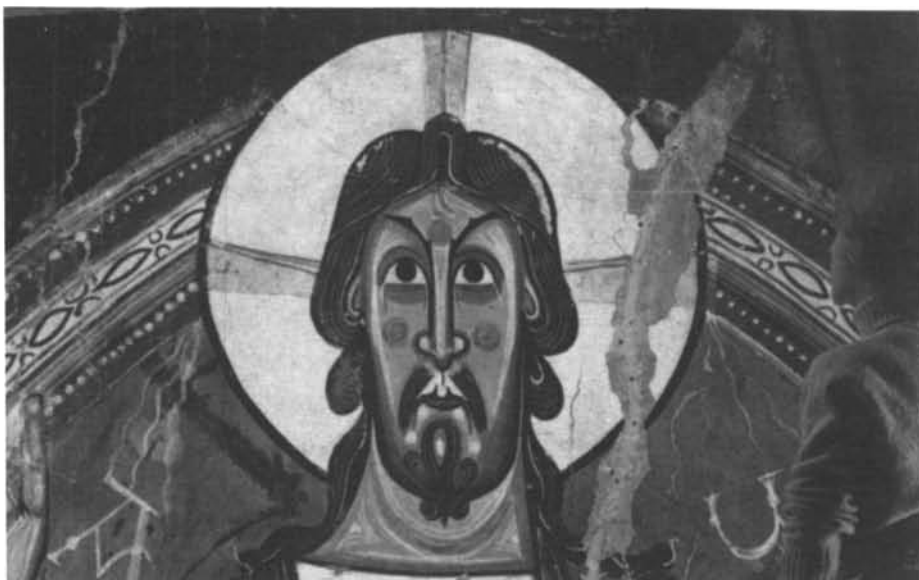
Pantocràtor romànic de Sant Climent de Taüll. (Museu d'Art de Catalunya).

Q uantes pintures datables el primer quart del segle XVI hi ha a Catalunya, fora de Barcelona, i quina és la seva referència completa? Quins pintors van exposar les seves obres a Barcelona entre el 1888 i el 1917? Quina és la primera representació d'unes ulleres en la pintura catalana que conservem al país? Quantes representacions del Calvari conservem? On és possible d'obtenir en uns instants una còpia de les fitxes tècniques completes de qualsevol obra d'un pintor que es conservi a Catalunya? Aquestes i moltes altres qüestions i anhels que —plantejats aquí d'una manera més anecdòtica que rigorosa— podrien formular-se historiadors de l'art o qualsevol altra persona i que ara per ara només poden trobar resposta després de llargues hores de treball i de nombrosos desplaçaments, podrien ser aviat contestades amb una més gran certesa, des d'un mateix lloc, que tant podria ser Girona com Londres, i en només uns segons gràcies al Banc de Dades Taüll, el primer banc de dades de pintura que hi ha als Països Catalans.