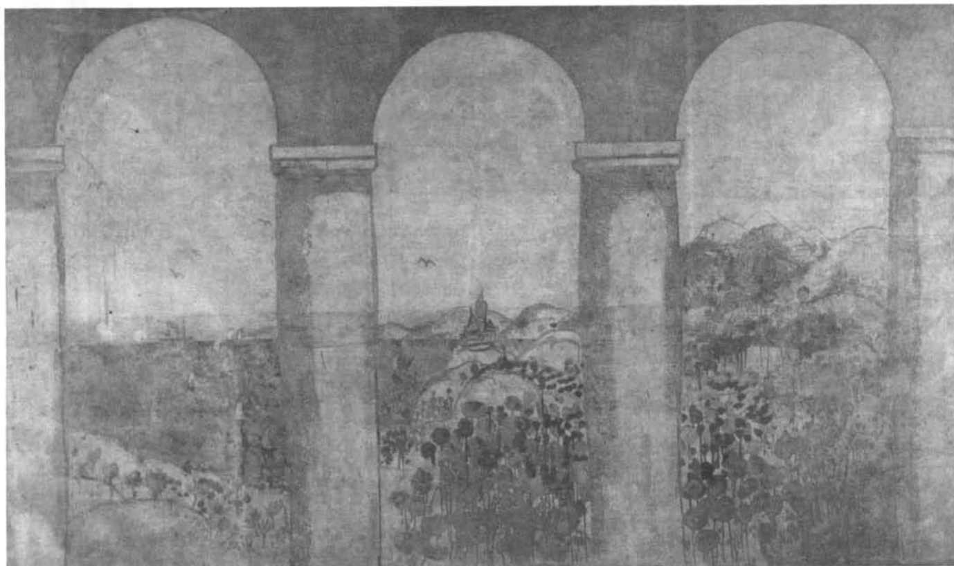
Xavier Nogué. Detall del fresc del Celler de les Galeries Laietanes, 1915. (Museu d'Art Modern, Barcelona).

seguiran, per la via de la informàtica, potenciant l'ús d'una mateixa normativa que, finalment, pugui satisfer tothom. Només enteses dins d'una política global d'aquest gènere, iniciatives com ara la del BDP Taüll poden tenir sentit.