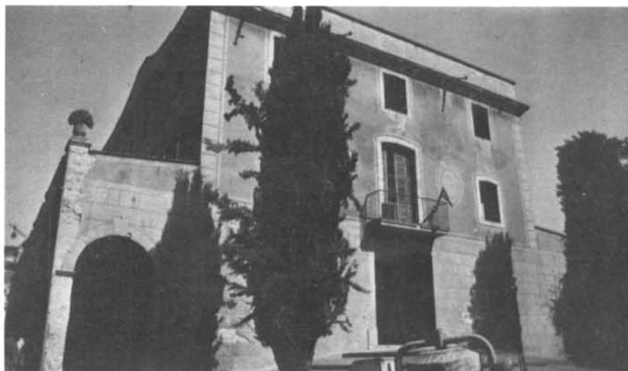
A dalt, museu de Gavà. A sota, gràfic amb el número de museus a cada comarca i taula comparativa dels habitants per museus.

En aquesta classificació, ens hem deixat com a cas específic, el Museu de la Ciència i la Tècnica de Catalunya a Terrassa, finançat íntegrament per la Generalitat i amb un