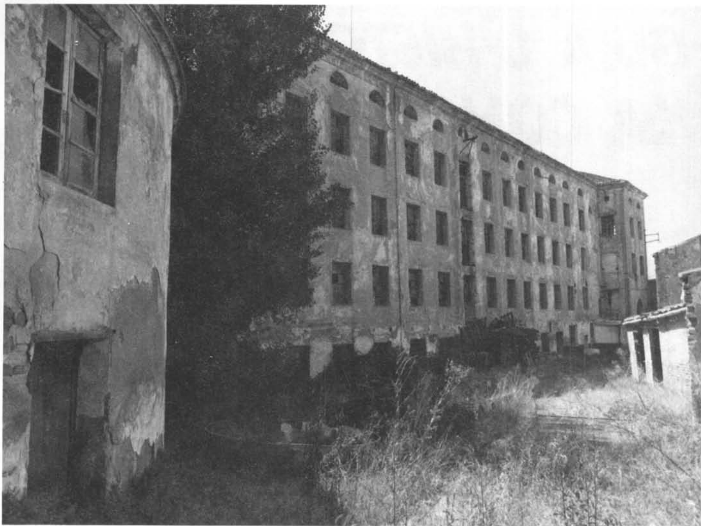
Vista externa de la Igualadina Cotonera, fàbrica de tipologia manchesteriana de mitjan segle XIX.

el risc d'oblidar que en aquest intervenien persones i que, en definitiva, l'objectiu final de la història és l'home. Per això se l'ha de tenir en compte en l'anàlisi dels diferents canvis i, molt especialment, en la de les seves condicions de treball i d'habitatge.