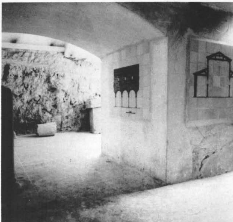
Interior de la basílica del segle IV del Museu d'Història de Barcelona.

Parteix de la voluntat de l'Àrea de Cultura d'impulsar i accelerar el procés de la reforma. En aquest moment el nou programa de remodelació es troba en un estadi de proposta global, un estadi que era necessari assolir ràpidament per tal d'adaptar la continuació de les obres arquitectòniques a la nova concepció del Museu. En aquesta primera etapa era molt important treballar, alhora, en tres plans diferents: el museològic, l'històric i l'arquitectònic. Més endavant aniran intervenint especialistes de cada un dels tres camps. Fins ara, però, ha estat ja molt decisiva la crítica i l'ajut de tècnics que provenen d'aquestes tres branques.