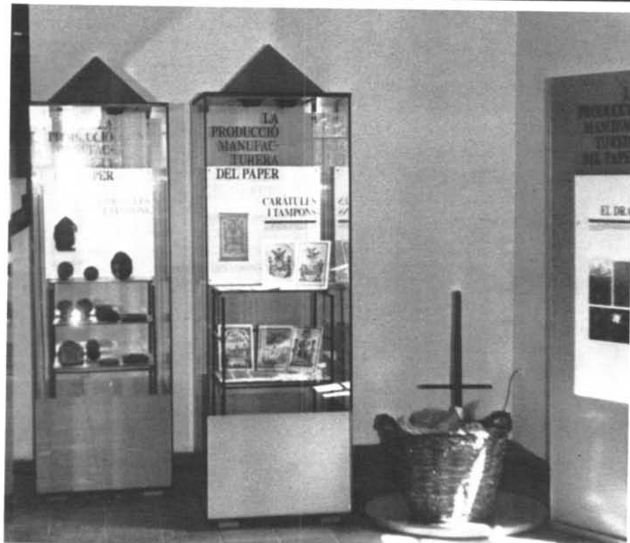
Vitrines del Museu on s'explica la producció manufacturera del paper i els productes finals, en aquest cas caràtules i tampons.

introducció al procés d'elaboració és realitzada a partir d'unes fotografies, explicades amb el text d'una auca del segle XVIII.