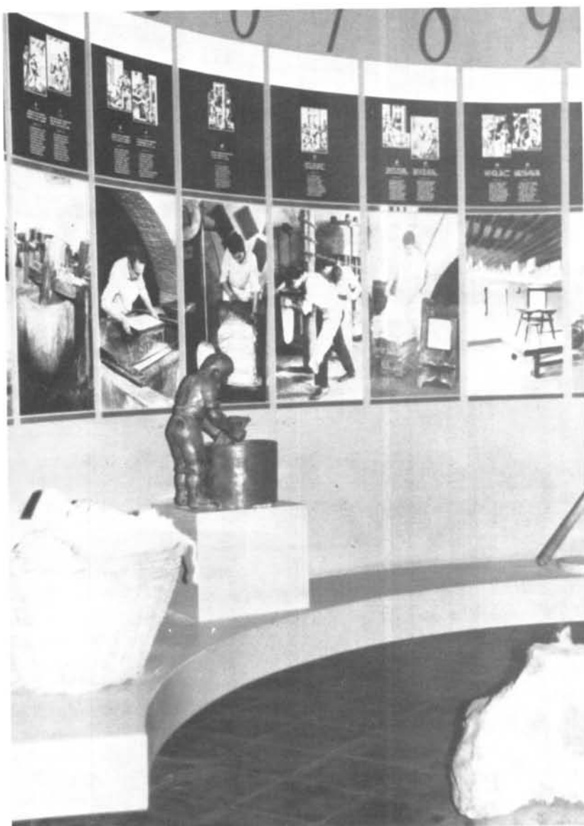
Mostra d'una part del nou muntatge gràfic i didàctic del Museu Moli paperer de Capellades.

El segon apartat és dedicat a la història del paper a Catalunya, i es posa en relació la tècnica del primer paper català amb la utilitzada a Al-Andalus. La papereria catalana va travessar una greu crisi al segle XV, segons el guió explicatiu, com a resposta a la competència italiana i a la manca de protecció de la Corona. En canvi, l'esplendor nascut a partir del segle XVII s'interpreta com a resposta a una major protecció i un millorament de les tècniques, i que provocà l'inici d'un període d'expansió que va arribar a la seva màxima fita a partir del decret de lliure comerç del 1778 amb Amèrica. Aquesta