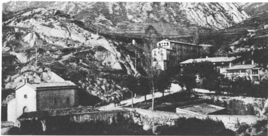
«Cal Lluís Né», també anomenada «Villa Rosa».

No és sobrer reflexionar per quin motiu costen tant de pair certes novetats al nostre món científic. Sembla que estiguem acostumats que ens avancin, en certs temes, els al-