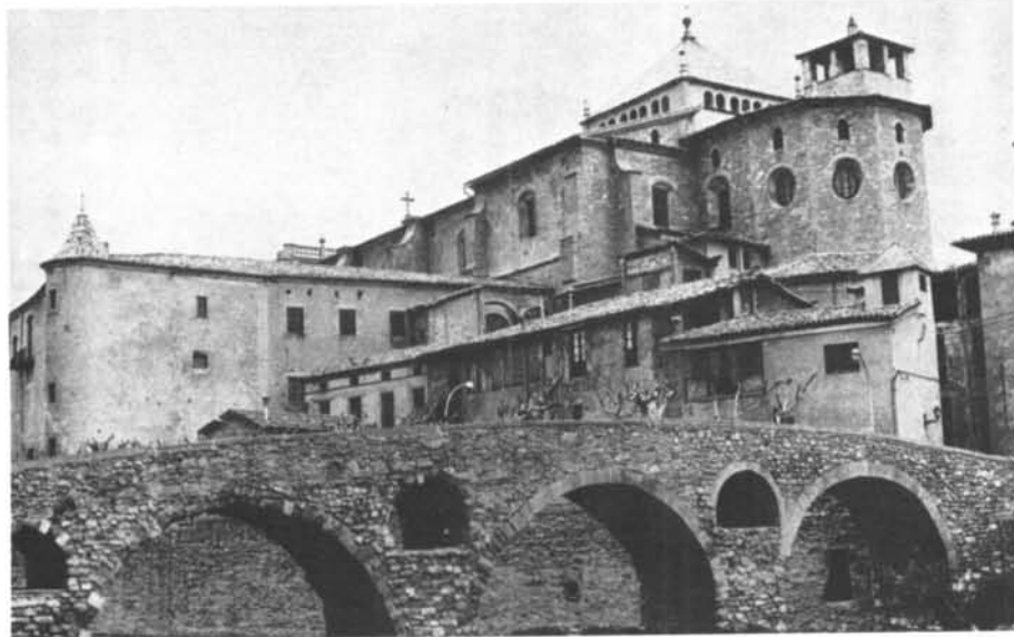
El bisbat de Vic, residència del bisbe Strauch.

de la tradició i la defensa de les seves antigues posicions. El bisbat de Vic serà el marc del segon enfrontament amb els seus vells i renovats enemics liberals. Les seves vicissituds, però, són il·lustratives del moment històric i serveixen de molt per entendre la societat osonenca d'aquells anys. Strauch en serà un element clau, car visqué en constant enfrontament amb les autoritats constituïdes. Enfrontament que es materialitzà en un rebuig constant a tota reforma, en una molt diplomàtica contestació mitjançant les seves ambigües pastorals, en l'organització de missions pel poble com les de 1821 amb un caràcter anti-liberal amagat però constatable, en la possible conspiració amb elements de aixecament reialista, etc. Tot plegat féu que fos detingut al seu palau l'11 d'octubre de 1822. Conduït a Barcelona a començament de novembre, per tal de ser jutjat com un dels col·laboradors de la Regència d'Urgell, en sortí el 16 d'abril de 1823 amb la intencionalitat declarada de traslladar-lo a Tarragona. La veritat fou que prop de Vallirana el feren baixar de la tartana i, al mig d'un bosc, fou afusellat juntament amb un seu acompanyant. S'acabaria l'home, però començaria el mite probablement més rendible pels defensors de la tradició, amb una transcendència històrica que ara analitzarem.