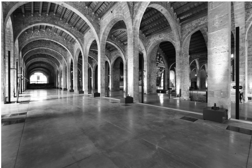
FIGURA 2. Vista de l'interior de les naus de les Drassanes Reials de Barcelona una vegada finalitzades les obres de restauració al 2013 (MMB; foto: José Biel).

havia estat objecte d'intervencions arquitectòniques i d'altres excavacions puntuals, gens sistemàtiques i en general mal documentades. 10