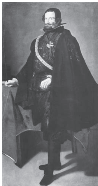
FIGURA 3. Diego Velázquez, El Conde-Duque de Olivares , c. 1625, Nueva York, The Hispanic Society of America.

nada mejor que nadie en aquellos días por el mismo conde duque de Olivares.