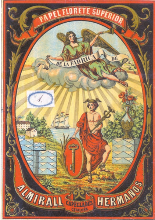
FIGURA 3. Caràtula de la fàbrica dels germans Almirall i Lluçia, de la segona meitat del segle XIX, on el déu del comerç, Mercuri, sosté la marca de la clau; també hi apareixen la fàbrica, les raïmes de paper i un vaixell que simbolitza el comerç amb les excolònies americanes.

segon pis. Va romandre al capdavant del negoci familiar durant 24 anys, els mateixos que hi havia estat l'oncle Vicenç.