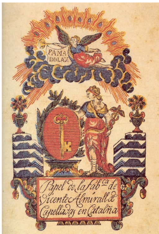
FIGURA 2. Una de les primeres caràtules papereres dels Almirall, amb la marca de la clau.

El 1798, Vicenç Almirall declara posseir un molí —de primer fariner, més endavant draper i ara fàbrica de paper blanc— amb un hort contigu i dues peces de terra comprades pel seu avantpassat directe Arnau Guillem el 1528. També posseeix nou peces de terra més —de bosc, de vinya i d'altres conreus— i diversos censals, que li donen algunes rendes anuals. Almirall fa viatges a l'Aragó i a Castella per comprar llana per al consum de la seva fàbrica 31 .