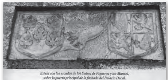
Estela con los escudos de los Suárez de Figueroa y los Manuel, sobre la puerta principal de la fachada del Palacio Ducal.