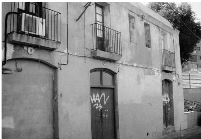
Fig. 8 Cases del carrer Jocs Florals. La última és la número 13. Les cases núm. 15 i 17, avui dia, ja estan enderrocades.

En Pere tenia un caràcter molt agradable, de fer amics i molt de la broma. Era molt respectuós amb tots i s'estimava molt la seva dona i les seves filles.