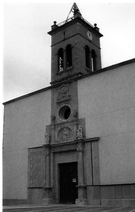
Fig. 3 Sant Llorenç de Bescanó Existent el 1058. Temple del s. XVI gai- rebé totalment reconstruït a inicis del s. XIX