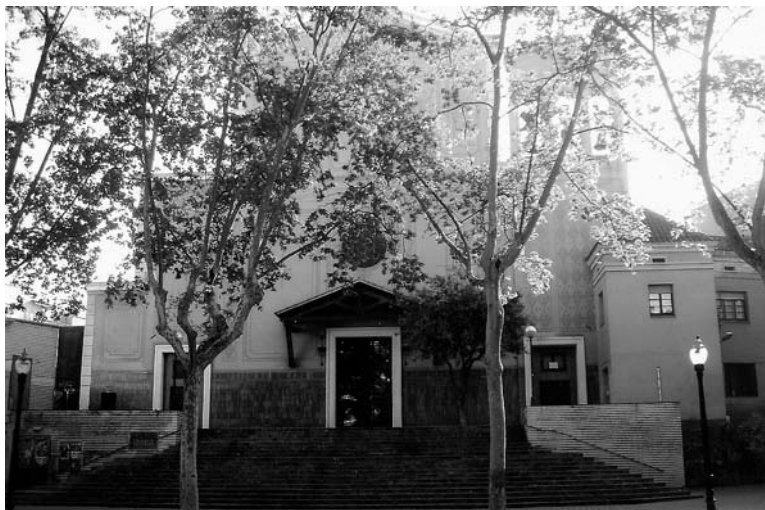
Fig. 5 Parròquia de Santa Maria de Sants (Barcelona). Sants, poble del pla de Barcelona. L'any 1883, es agregat a Barcelona, el 1884 es torna a independitzar i l'any 1897, és agregat, definitivament, a Barcelona.