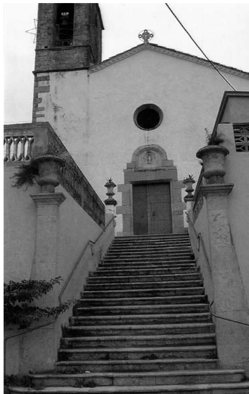
Fig. 1b Sant Pere de Llorà Llorà, municipi de Sant Martí de Llémena, existent el 986. Església del segle XI amb campanar de torre modificada el S. XVII