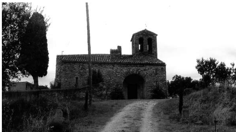
Fig. 2 Santa Cecília de les Serres