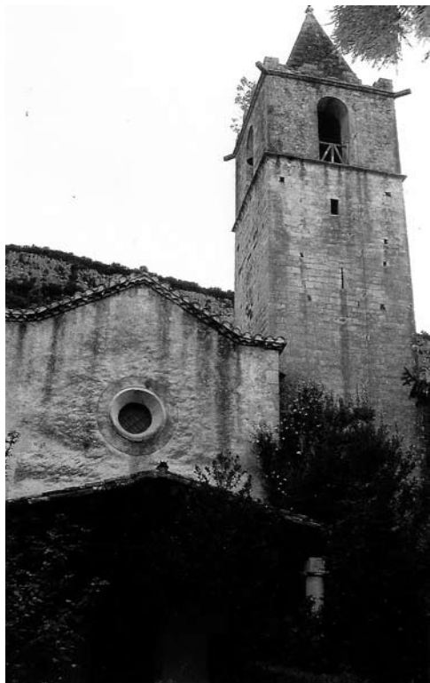
Fig. 1a Sant Pere de Montfullà Montfullà, poble del municipi de Bescanó, principalment disseminat, ja documentat l'any 882.

Montfullà és una població molt antiga. Sota l'església, s'han trobat restes d'una vil·la romana, datada al S. I d. C.