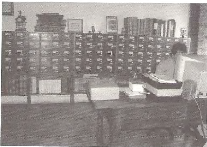
Calaixos d'esmenes i disposicions apostòliques a l'Arxiu Diocesà de Barcelona

A l'Arxiu Històric de la Ciutat de Barcelona vaig descobrir una sèrie de llibres amb la biografia d'alguns dels meus avantpassats (tot i que també hi són a altres arxius i biblioteques):