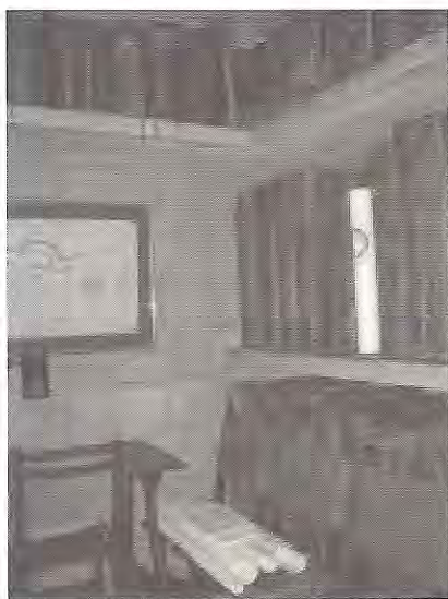
Cambreta de llibres antics a l'Arxiu de la Catedral de Barcelona

va totes aquelles anècdotes i fets que li havien explicat de petita i no surten reflectits en cap document.