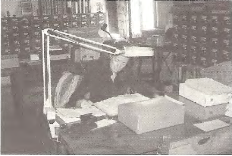
Espai de consulta a l'Arxiu Diocesà de Barcelona

1850 al 1911, en diferents llibres i carpetes. Els matrimonis del 1800 al 1850 no disposen d'índex. No recordo si tenen els matrimonis del 1850 al 1900, però un dels llibres són entaulaments de baptismes i matrimonis del 1895 al 1942. En un altre trobem entaulaments de baptismes del 1749 al 1911 (però no us en feu il·lusions... no hi ha gairebé res). A la mateixa parròquia conserven alguns dels llibres de l'antiga parròquia de Sant Francesc (el que en queda): baptismes en diferents llibres del 1844 al 1953 i del 1864 al 1950. Com podem veure, tot plegat és una mica embolicat. Però val la pena!