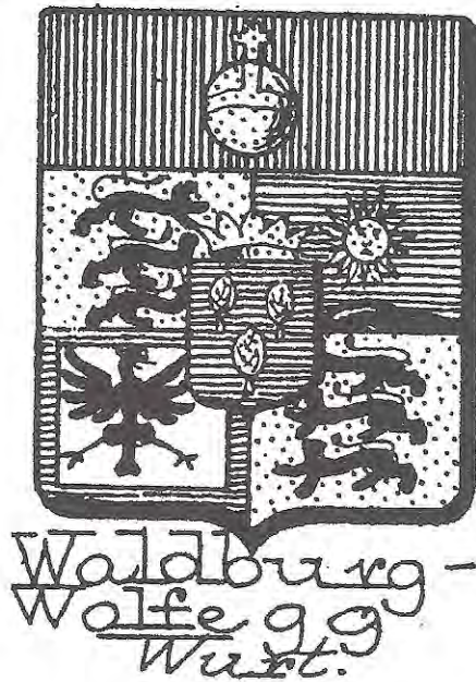
Figura 3. Escut dels Waldburg