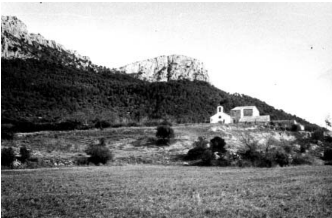
Santa Maria del Mar és una de les capelles més antigues del Montgrí; ja apareix citada en un document del 833.

vida a la capella tot sent-ne proveït de menjar, beguda, vestit i calçat, i, finalment, el 1309 un altre veí de la mateixa vila, "a honor de Déu i remissió dels seus pecats" i per tal que sempre cremés una llàntia, cedia a la capella una terra al Llentisclar i un cens de 10 sous que es garantia sobre un alberg a Castelló d'Empúries 26 . Les almoines i devocions no sempre arribaven soles i calia anar a acaptar-les: els anys 1311 i 1314 el clergue de la capella encarregava a dos frares que rebessin les almoines i vots que oferissin els devots tot autoritzant-los a oferir les indulgències concedides per l'arquebisbe de Tarragona i el bisbe de Girona 27 .