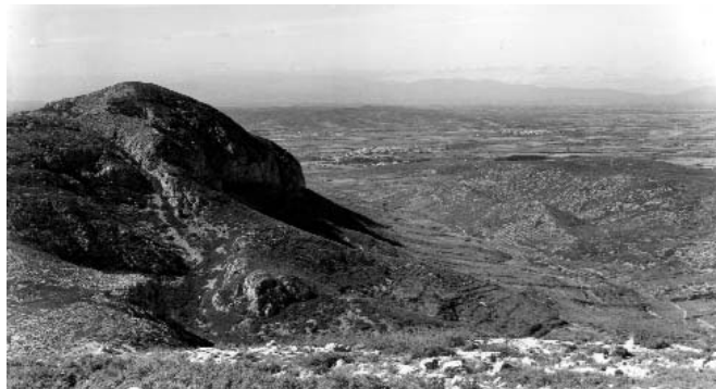
El Montgrí, ahir i avui un territori feréstec