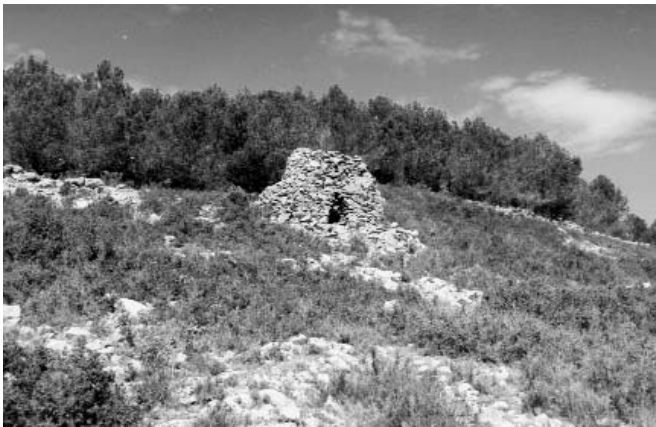
Les cabanes i altres construccions evidencien l'ocupació ramadera del Montgrí.

la montanye" i el 1374 la mateixa obligació s'imposava als veïns d'Ullà 44 . La prova més conculent de la presència dels ramats al Montgrí, però, la proporcionen les desenes de vendes de llana –conservades als registres notariais de Torroella de Montgrí, d'Ullà i de Castelló d'Empúries– que, sistemàticament, establien com el lliurament de la llana s'havia d'efectuar el mes de maig –o al "temps d'esquil·lar"– a la "muntanya de Torroella". Durant els mesos de la hivernada, per tant, pel massís hi devien pasturar milers d'ovelles vigilades de prop pels seus pastors i aquesta ramaderia havia de viure el seu moment culminant el mes de maig quan mercaders de llana –però també de bestiar– i negociants de tota mena convertien el Montgrí en un autèntic formiguer humà. En la cria de bestiar oví i en el mercadeig d'animals i de llana, els habitants del Montgrí hi tenien un paper destacat 45 . El 1325, per exemple, un veí d'Ullà pagava a un de Sobrestany el bestiar que li havia comprat i el 1327 era un habitant de l'Aragall que acordava vendre tota la llana del seu bestiar a un mercader de Camprodon 46 . Així, no sorprèn veure que el 1371 a Sobrestany diversos veïns declaraven que disposaven de closos –"ovili", en llatí– específicament destinats a guardar-hi ovelles 47 .