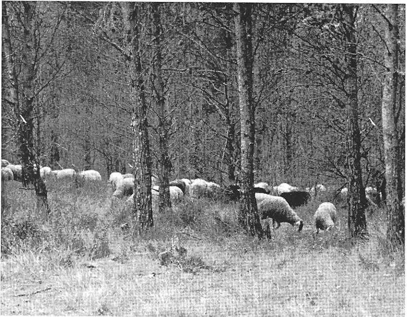
Ramat de xais al Montgrí

Tot terreny que oferís unes mínimes condicions ja era destinat a la ramaderia. A banda de l'establució d'alguns animals als closos urbans, els prats del pla i les fondalades del Montgrí eren els espais de la pastura. El febrer de 1327 s'arrendaven les pastures de les deve-ses reials amb la condició que només hi entressin vaques, eugues i bous, i excloent-ne expressament ovelles, porcs i cabres; però l'agost de 1350 s'autoritzava a tenir “XXV besties de lana e aqueles ... menar ... en lo Plan de Torroella” sempre que no s’hi gosés “mesclar porch ni truja ni cabra ni boch”. La muntanya del Montgrí constituïa un punt fonamental d'un circuit de transhumància que lligava l'Empordà amb les altes valls del Ripollès i del Conflent. Extensos ramats de fins a 600 i 800 caps hi passaven la hivernada. Andreu Sàbat el 1672 en confessava la pobresa, però la reconeixia “molt apta per.a bestiar manut tant per viure y engrexar.se com per lo gust de la carn” i el novembre de 1345 la cort privava de tenir “mes de XXV besties de lana sino en la montanye”.