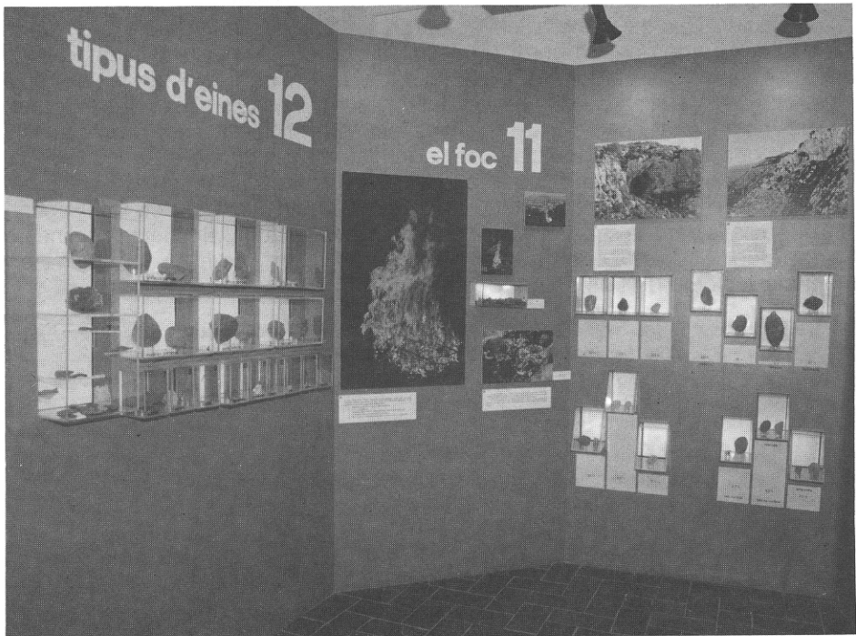
Museu del Montgrí i del Baix Ter. Sala del Paleolític.

El 1977, J. Vert, X. Puig, E. Carbonell i J. Canal realitzen un nou estudi de tots els materials conservats al Museu de Torroella, amb 592 útils sobre còdol i 1746 sobre ascla. Ara ja no hi veuen res de Mosterià, però hi distingeixen dos moments diferents, un amb útils de gran tamany, que seria del Mindel o del Mindel-Riss, i un altre amb útils sobre ascla, amb un índex levallois del 33%, que es dataria cronològicament al Riss III.