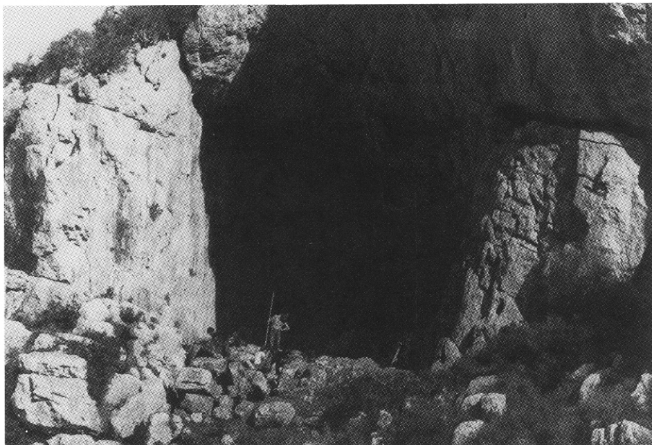
Excavant el Cau del Duc de Torroella.

L. Pericot i M. Pallarès assenyalaven que la talla en quarsita és general en el Mosterià i en el Paleolític Inferior, i que durant el Paleolític Superior aquest tipus d'indústries perduren al costat de les indústries de sílex fins arribar al pas del Paleolític al Neolític. Però també indiquen que la majoria dels especialistes que han vist els materials dels dos Caus del Duc creien que es tractava de materials de la cultura anomenada Asturià. Així, Hugo Obermaier (1925), l'autoritat amb més crèdit en aquell moment, es basava en la presència d' Ursus arctos en el Cau del Duc d'Ullà per creure que aquest jaciment no podia ésser paleolític. A més, la poca profunditat de terres en el Cau del Duc de Torroella hauria demostrat que el jaciment, si bé era anterior al Neolític, ja que faltava la ceràmica, no podia remuntar-se a una època geològica remota, i la seva fauna tampoc no es podia atribuir al Paleolític. Per tot això van concloure que calia situar el jaciment cronològicament en el Mesolític o Epipaleolític, en un moment de decadència de la talla de pedra, i culturalment com una varietat de l'Asturià.