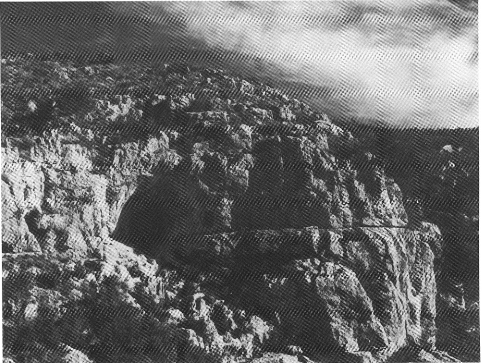
Cau del Duc d'Ullà.