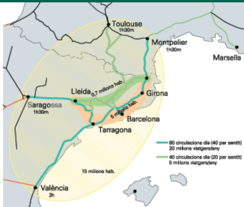
Figura 4 Pla ferroviari II