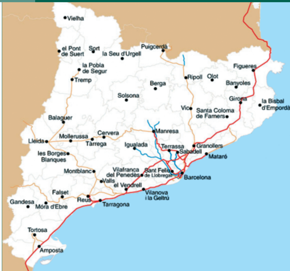
Figura 2 Xarxa ferroviària de Catalunya. 2002

D'altra banda, el Centre d'Innovació del Transport de la UPC ha realitzat per al Port de Barcelona l'estudi La nova línia Barcelona-Perpinyà i el trànsit de mercaderies , referent a la línia d'alta velocitat. Aquest estudi es basa en les conclusions d'uns altres realitzats pel mateix organisme: