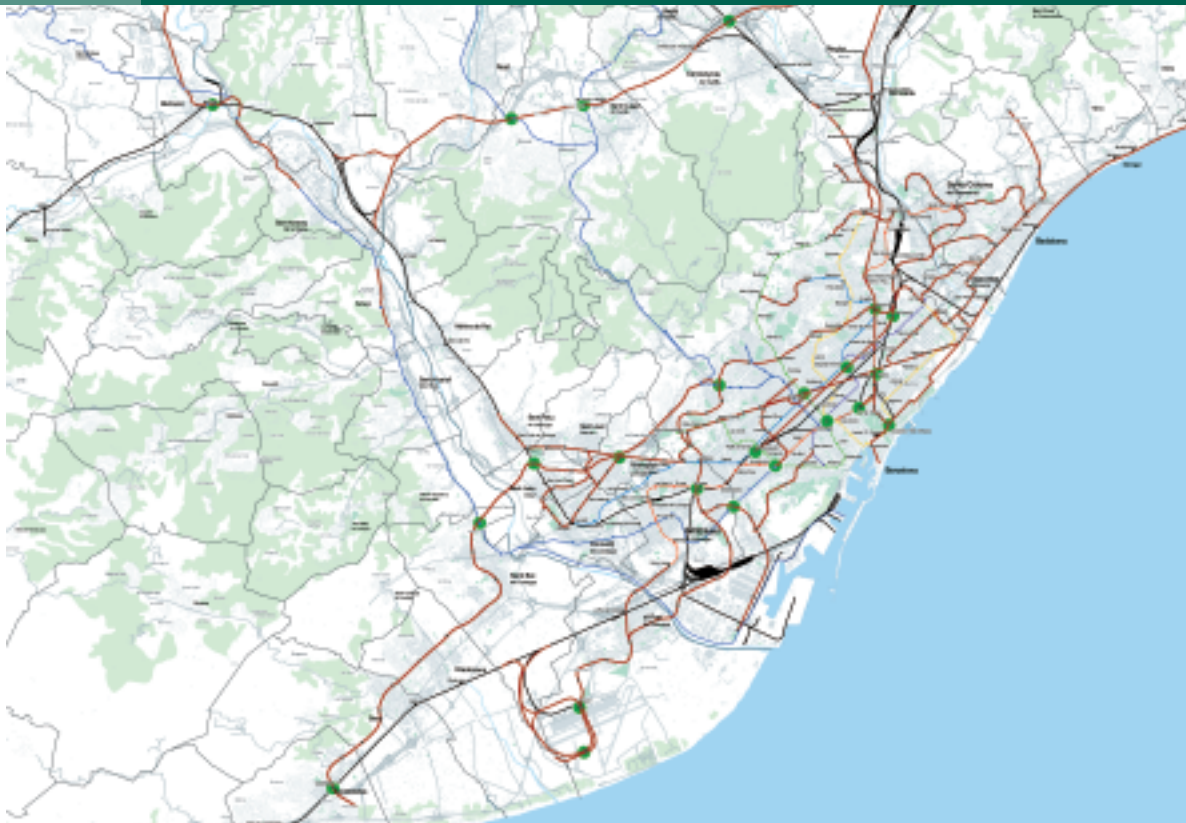
Figura 1 Intercanviadors inclosos en el Pla Director d'Infraestructures 2001-2010 (PDI)

El PDI és un pla d'infraestructures de transport públic col·lectiu, bàsicament ferroviàries, tot i que també s'hi