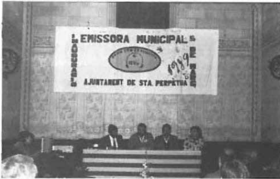
Santa Perpètua ja té la seva emissora de Ràdio