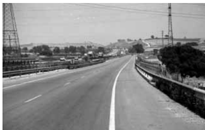
1983: Desviament B-140. (AMSPM)

la peligrosidad y la estrechez de la misma, insuficiente para soportar intensidad del tráfico diario y generadora de múltiples atascos circulatorios y colisiones de vehículos y riesgos para peatones, alcanzando también este desvío al puente de esta carretera existente sobre Riera de Caldes que se presenta estrecho, peligroso e inseguro. 35