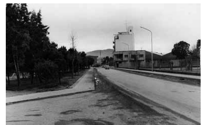
Anys 60-70: Cruïlla pont vell i Rambla. Av. Barcelona i av. Santiga. (AMSPM)