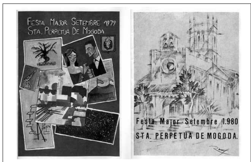
Cartells de la Festa Major