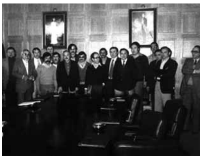
1979: Regidors primer ajuntament democràtic. (AMSPM)

Durant aquest primer any, el nou consistori, obligat pel marc legislatiu i per la manca de recursos, continuarà els projectes de l'anterior. El fet més important és que es van haver de prorrogar els pressupostos del 1978, basando esta prórroga en la circunstancia de no preverse, dado el estado avanzado del ejercicio económico, variaciones substanciales en ingresos ni en gastos, por no preverse creación de nuevos servicios... 23 Així es continuarà, com abans, arrendant locals per a activitats escolars, comprant sòl per a equipaments, ampliant el clavegueram, pavimentant nous carrers, etc. El Mercat Municipal, projectat i realitzat per l'anterior consistori, l'inaugurarà el nou, el setembre del 79. Tenint en compte l'eterna escassetat d'aigua, es construiran nous pous i es farà arribar l'aigua potable al barri de Mogoda, a principis dels 80. Al febrer d'aquest any, l'ajuntament accepta rebre definitivament les piscines, una vegada corregides per l'empresa constructora les deficiències que es varen detectar, i a l'abril es col·locaran semàfors a l'avinguda de Santiga per evitar els continus accidents i el caos