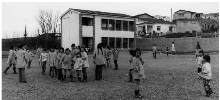
CEIP La Florida anys 70 (AMSPM)

Aquest ajuntament s'adherirà al conjunt de reformes polítiques que van permetre el pas d'un règim feixista a una democràcia: Referèndum per