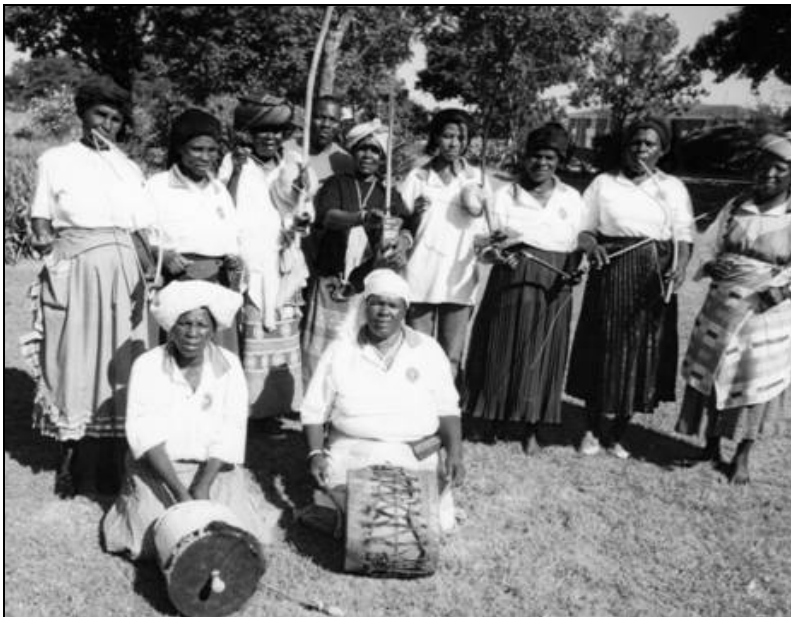
Foto: el grupo Ngqoko en 2002

ocasiones, él era la única persona del grupo que sabía hablar inglés y él mismo es un buen intérprete de canción tradicional y de danza. Cuidó del grupo en los como mínimo ocho viajes que éste realizó al extranjero para dar conciertos -a varios países de Europa y una vez también a la isla de la Reunión- así como en numerosas actuaciones por toda Sudáfrica.